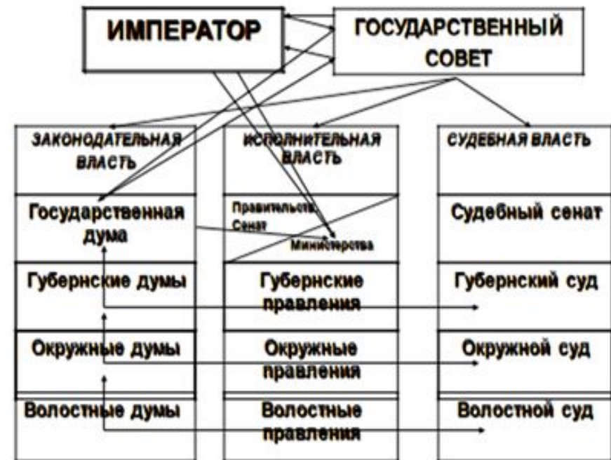
План государственных преобразований М.М. Сперанского

После Тильзитского мира царь снова поставил вопрос о реформах. В 1808 — 1809 гг. М. М. Сперанский, ближайший сотрудник Александра I, разработал «План государственного преобразования». План Сперанского, предусматривавший введение в России конституционного строя, вызвал резкую критику со стороны высших сановников и столичного дворянства. Из-за противодействия удалось учредить лишь Государственный совет — прообраз верхней палаты Думы (1810). Несмотря на то, что проект создавался в соответствии с указаниями самого царя, он так и не был осуществлен. Сперанский в 1812 г. был отправлен в ссылку.