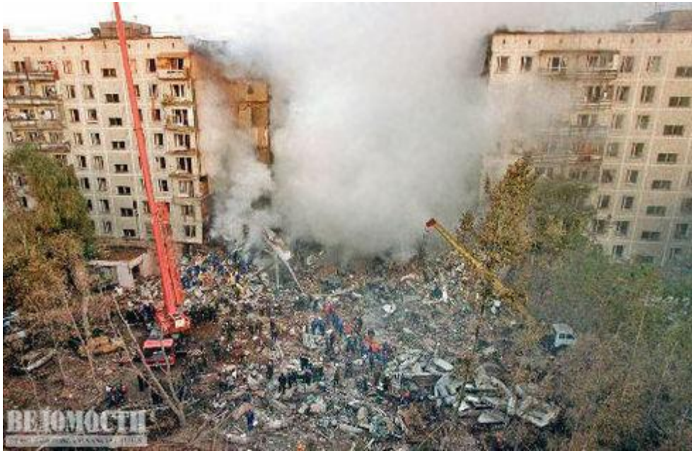
Теракт в Москве 1999