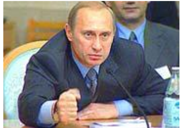
«Мочить в сортире!»