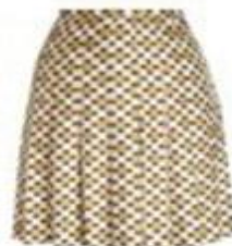
ЮБКА В СКЛАДКУ