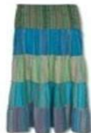
ЮБКА В СТИЛЕ БОХО