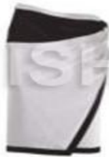
ЮБКА С ЗАПАХОМ