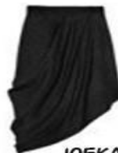
ЮБКА АСИММЕТРИЧНОГО КРОЯ