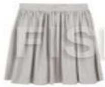
ШИРОКАЯ ЮБКА В СБОРКУ