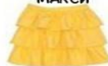
ЮБКА С ВОЛАНАМИ