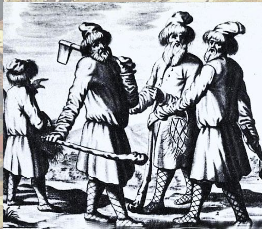
Русские крестьяне XVII в. Гравюра из книги А. Олеария.