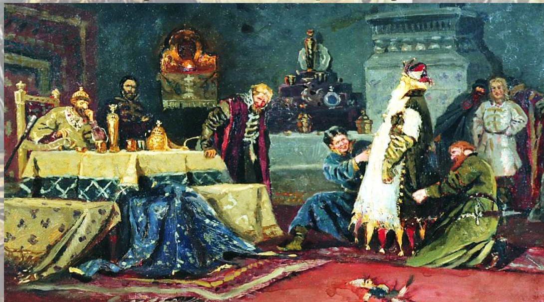
Нестеров М. «Боярин Морозов перед Иваном Грозным»