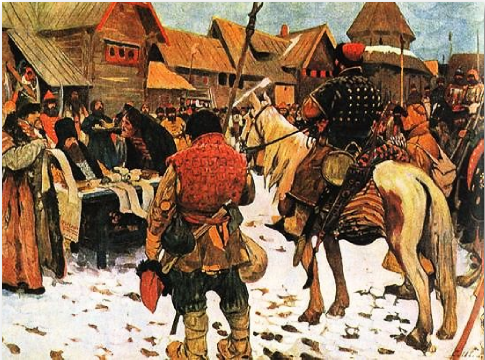
С.В Иванов «Смотр служилых людей»

Кем являются эти люди? Кто пришел на смотр? Кто осуществляет смотр? В чем смысл мероприятия? Что ожидало не явившихся на смотр?