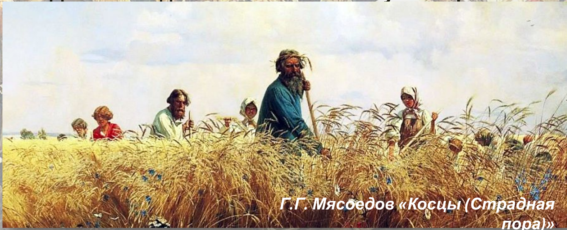
Г.Г. Мясоедов «Косцы (Страдная пора)»

В избе жила крестьянская семья, состоящая из 6—8 человек. В крестьянском хозяйстве трудились и мужчины и женщины. Женились рано — до 20 лет (в одиночку невозможно было вести хозяйство). Средний срок жизни крестьянина составлял 30—40 лет. Доживший до 45—50 лет считался уже стариком..