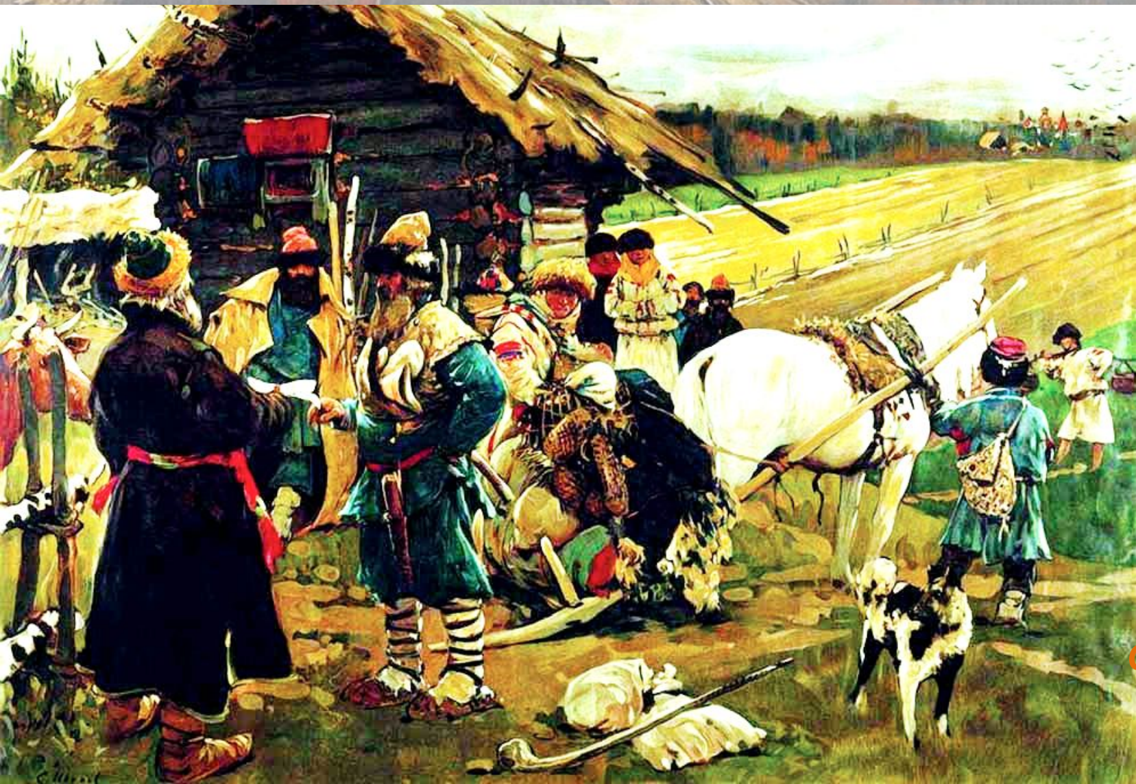
С. Иванов «Юрьев день»

Крестьяне имели право перехода от одного владельца к другому и заключали с землевладельцами договоры — «порядные грамоты».