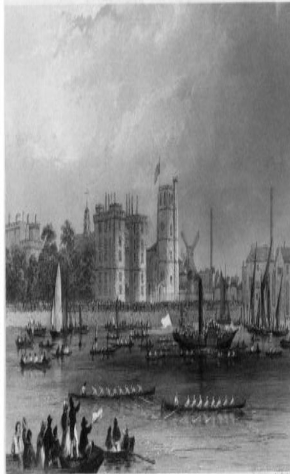
Grand Match between Oxford and Cambridge April 18, 1856 London Illustrated News, 1856