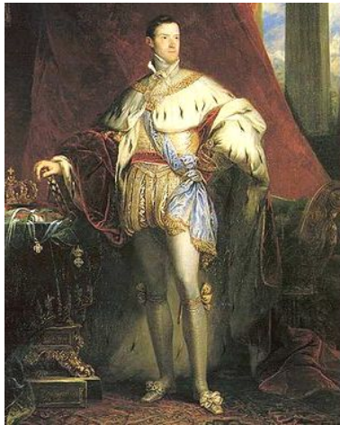
Король Пьемонта и Сардинии

24 марта 1848 года король Пьемонта (Сардинское королевство) Карл Альберт объявил войну Австрии. К нему присоединились Папская область и Королевство обеих Сицилий. Ход военных действий оказался неблагоприятен для итальянской коалиции, своего народа они боялись больше, чем австрийцев, а это рождало нерешительность. Благоприятный момент для разгрома и изгнания австрийцев из пределов Италии был упущен. После нескольких поражений в 1849 г. Карл Альберт отрекся от престола в пользу своего сына Виктора Эммануила II и бежал из страны.