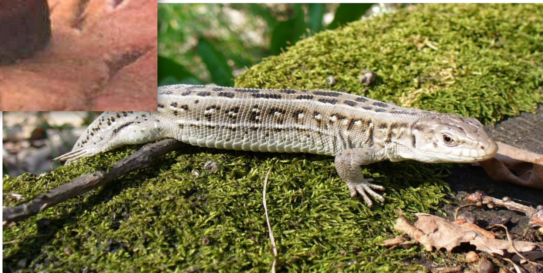
пресмыкающиеся (1 вид)