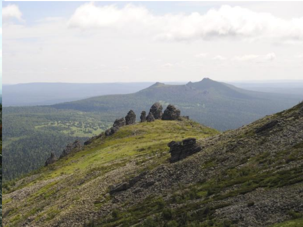
Вид на Средний Басег