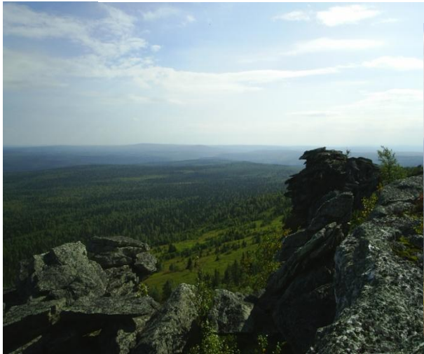
Вид на Южный Басег