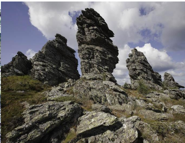
Останцы на плато Среднего Басега (каменный «пантеон»)