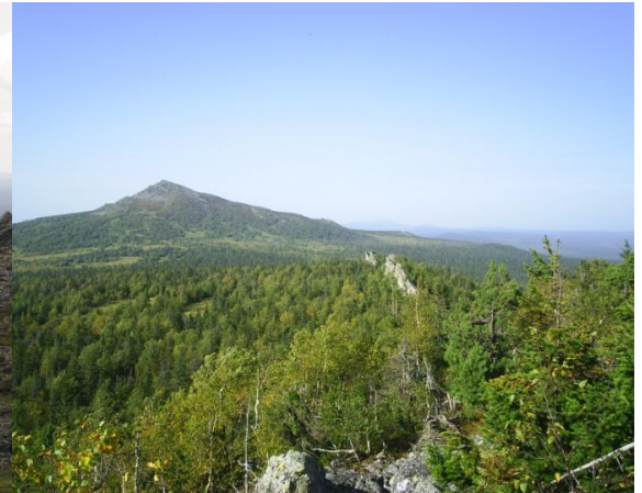
Вид на Северный Басег