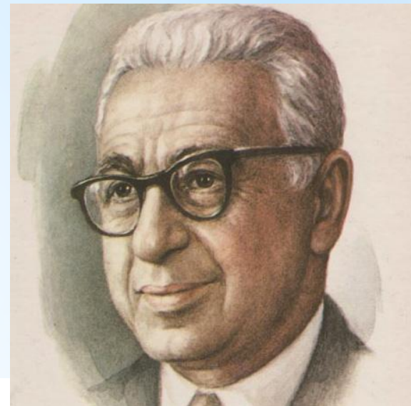
Матвей Исаакович Блантер