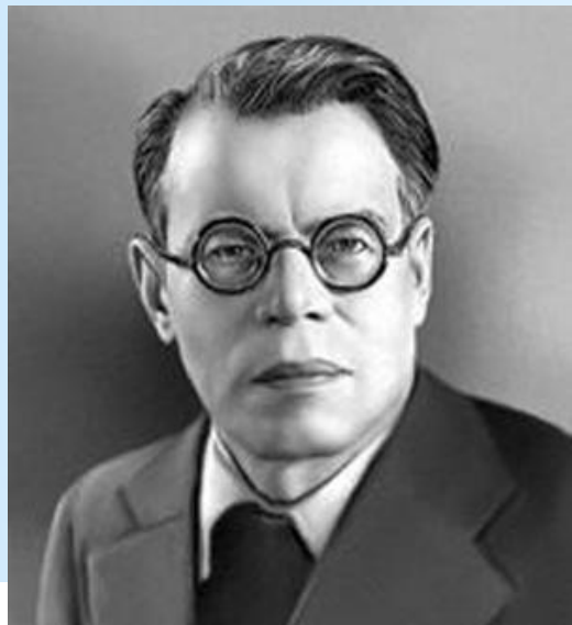
Михаил Васильевич Исаковский