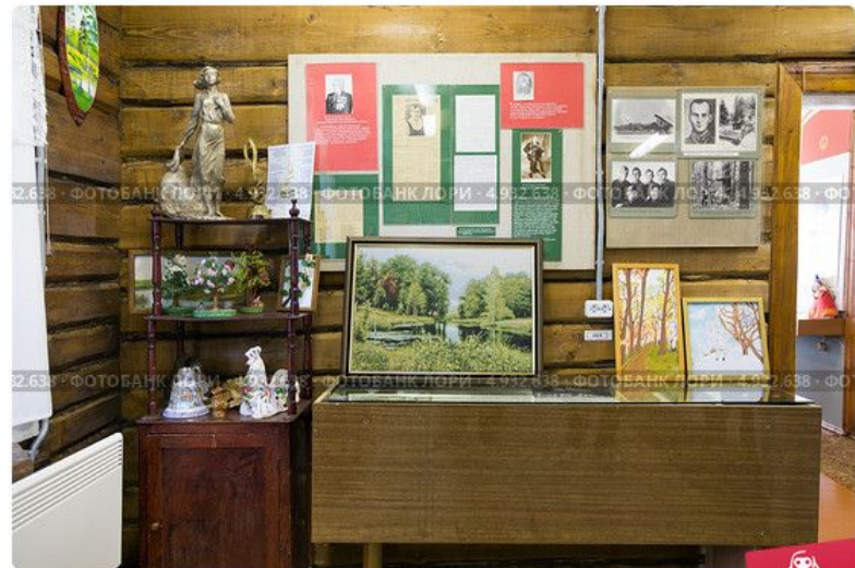
Мемориальный музей М.В. Исаковского (музей песни "Катюша")