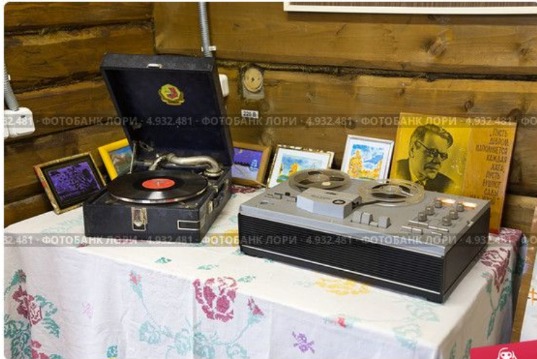
Мемориальный музей М.В. Исаковского (музей песни "Катюша")

В деревне Востоды Угранского района Смоленской области был создан Музей песни "Катюша", находящийся поблизости от родины поэта.