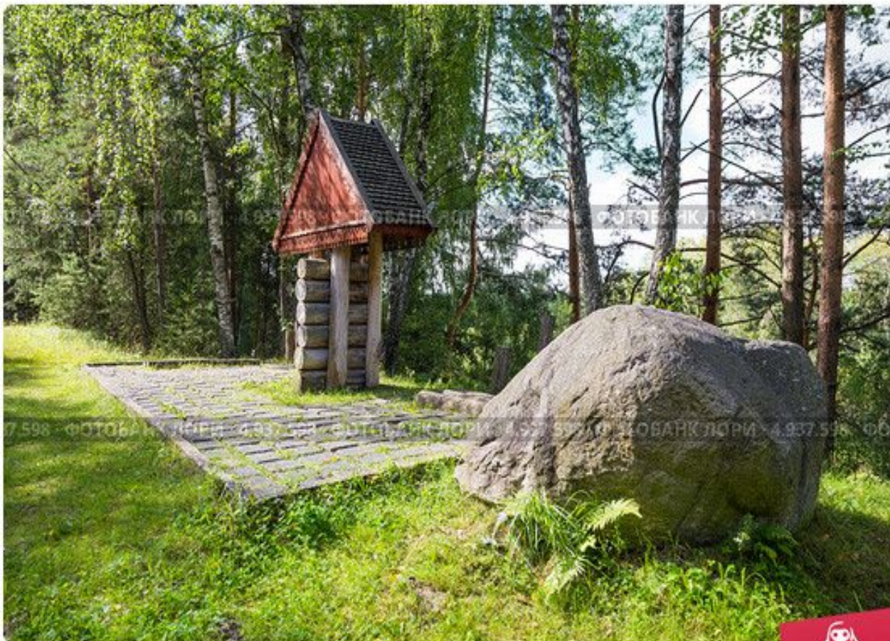
Памятник "Катюшин берег", посвященный песне "Выходила на берег"