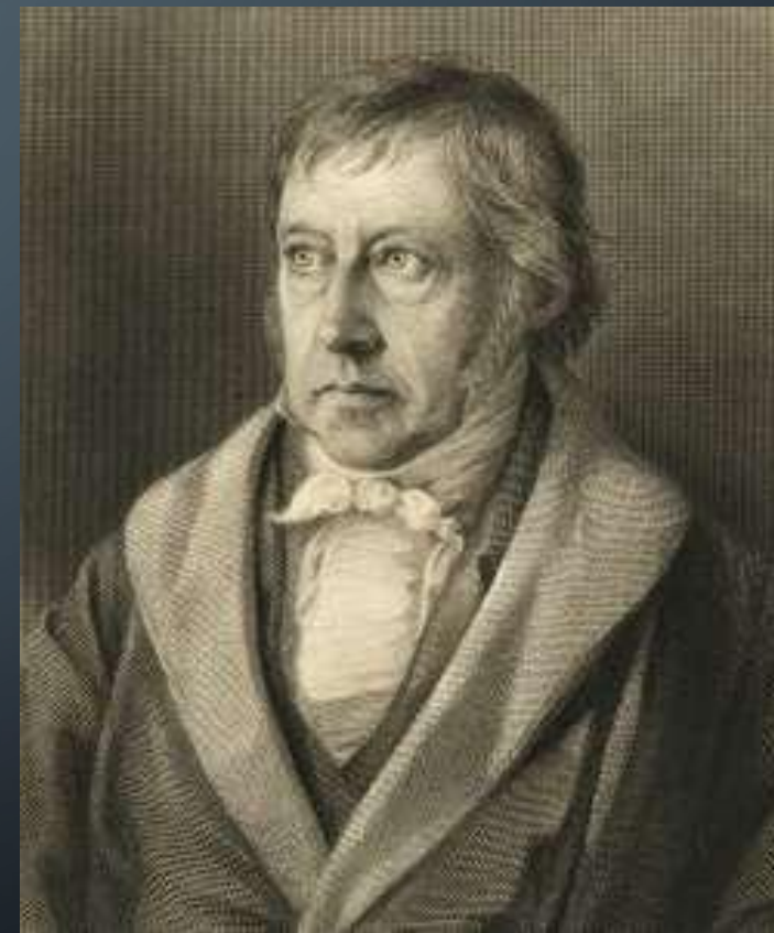
Georg Wilhelm Friedrich Hegel

ШИРОКЕ РОЗПОВСЮДЖЕННЯ ТЕРМІНУ "ФІЛОСОФІЯ ПРАВА" ПОВ'ЯЗАНЕ З ГЕГЕЛІВСЬКОЮ "ФІЛОСОФІЄЮ ПРАВА" (1820 Р.),