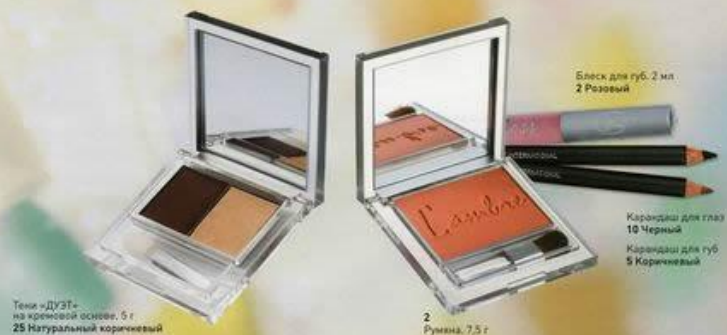
Тени «ДУЭТ» на кремовой основе, 5 г 25 Натуральный коричневый

При этом, дамы спортивного стиля очень тщательно ухаживают за своей кожей. Предлагаем им перед макияжем очистить и увлажнить лицо ЖЕМЧУЖНЫМ тоником, а затем нанести дневной ЖЕМЧУЖНЫЙ крем, который великолепно защитит кожу лица от агрессивного воздействия окружающей среды.