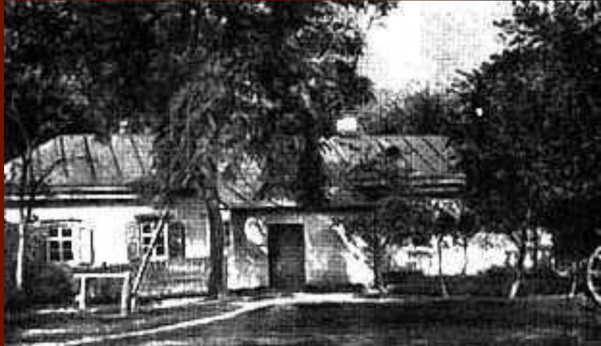
Дом доктора М.Я.Трохимовского в Сорочинцах, где родился Гоголь