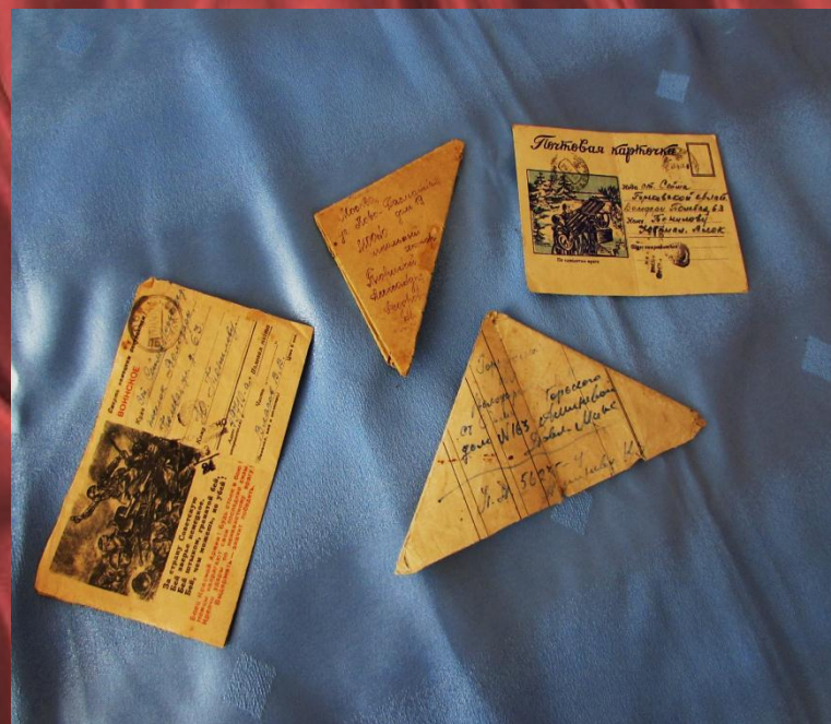
Фронтовые «треугольники» - экспонат выставки

1940 г. ГОРОХОВЕЦКИЕ ЛАГЕРЯ 137-я СД ЗАЯВЛЕНИЕ С СОЛДАТАМИ