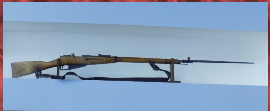
На выставке представлено легендарное оружие ВОВ Винтовка Мосина