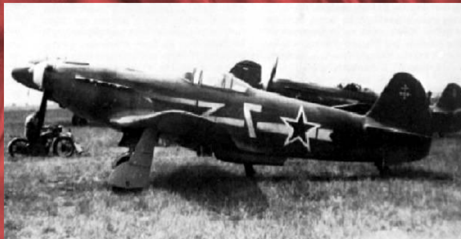
Модель истребителя Як-3, представленная на выставке. На таком самолете воевали лётчики "Нормандии"