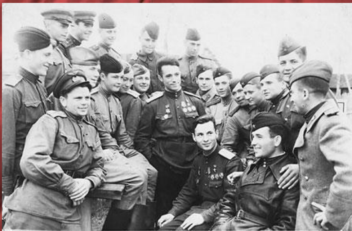
Молодые солдаты с летчиками-героями. 1944 г.