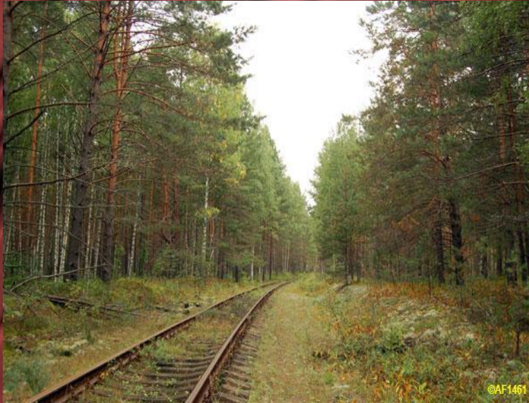
Бывшее испытательное кольцо железнодорожного полигона

В годы ВОВ в п.Центральном испытывались путеукладчики и путеразрушители, трофейная техника, , проводились учения, разрабатывалась организация управления, связи, обеспечения, готовились наставления по устройству и преодолению заграждений на железных дорогах и т. п.