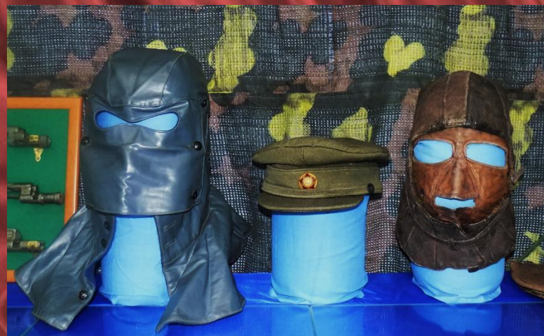
Головные уборы пилотов ВОВ - экспонаты выставки