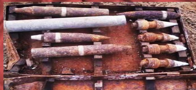
Осколки артиллерийских снарядов – экспонат выставки