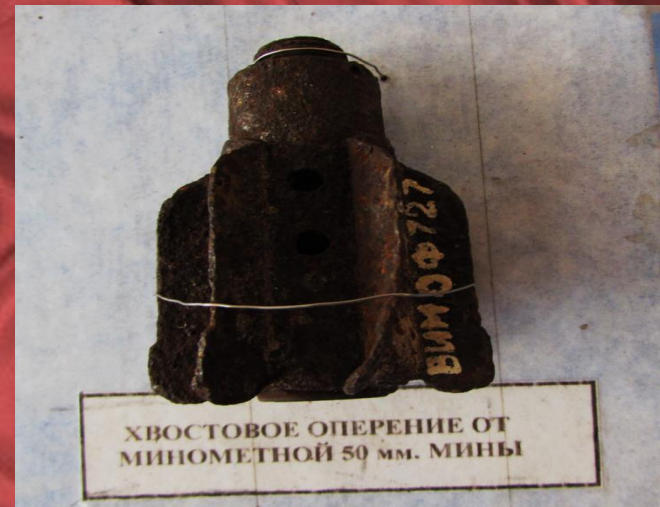
Осколки снарядов и мин – экспонат выставки