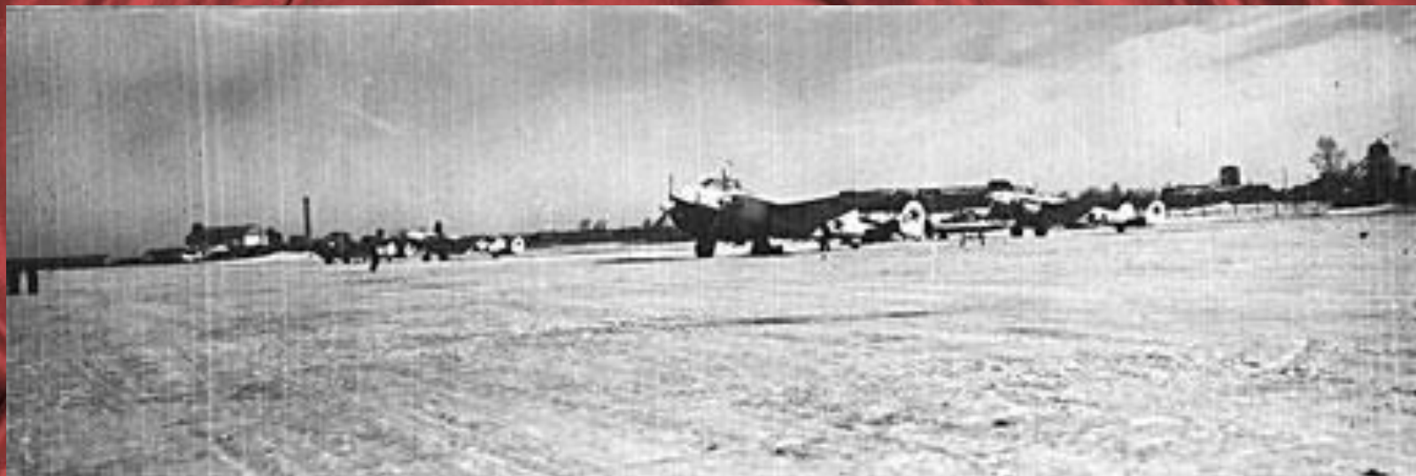
Военный аэродром ЗИАП-2 близ железнодорожной станции Сейма. 1942 г.

В начале Великой Отечественной войны полк реформировался во 2-й Запасный истребительный авиационный полк.