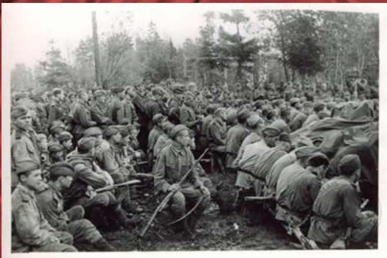
Солдаты 43-й (латышской) гвардейской стрелковой дивизии. 21 сентября 1943 г