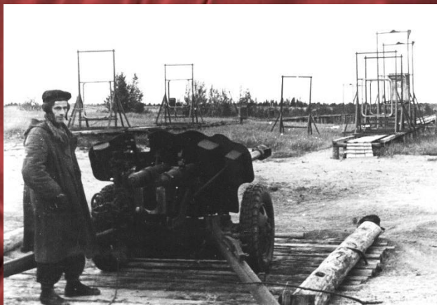
Испытания на Смоленском полигоне.