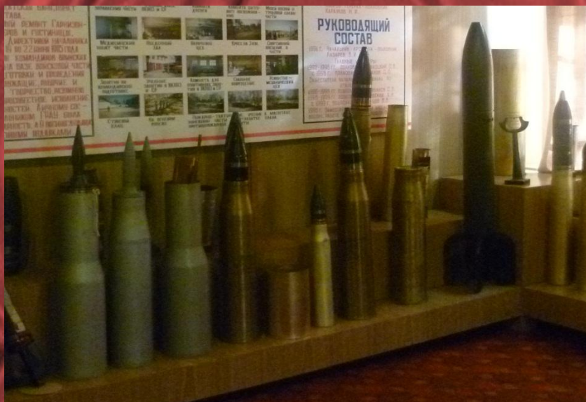
Снаряды времен ВОВ Экспонаты выставки