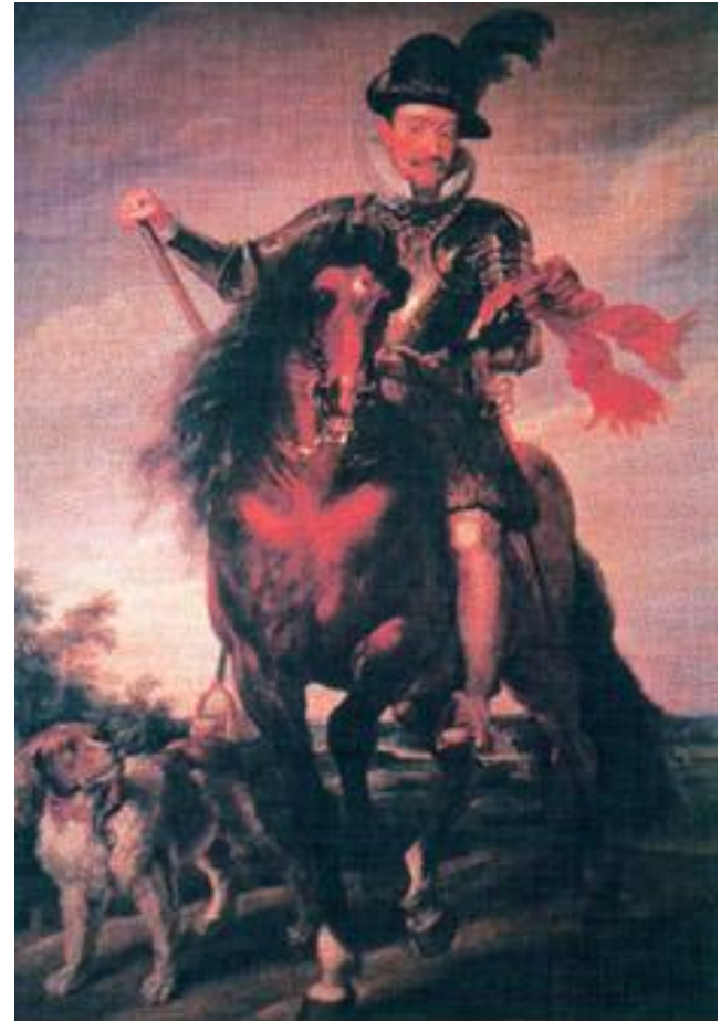
Польский король Сигизмунд III