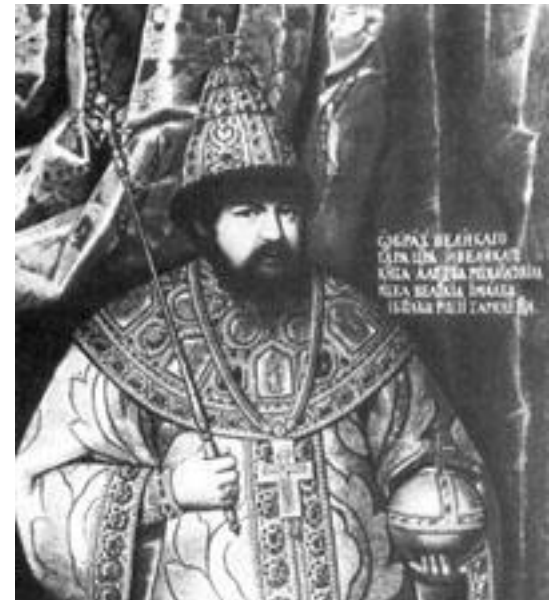
Царь Алексей Михайлович