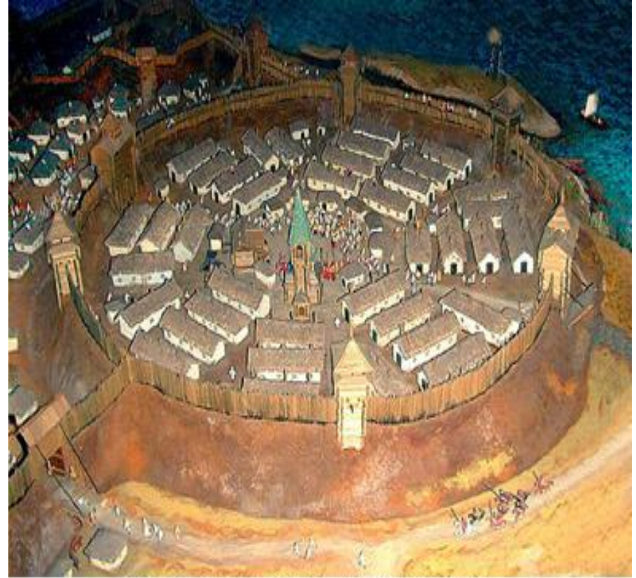
Запорожская Сечь. Реконструкция