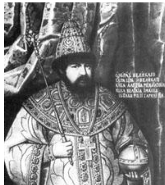
Царь Алексей Михайлович