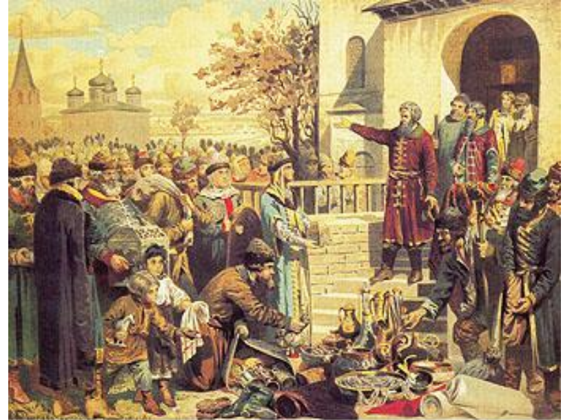
А.Д.Кившенко. Воззвание Кузьмы Минина к нижегородцам. 1611 г.