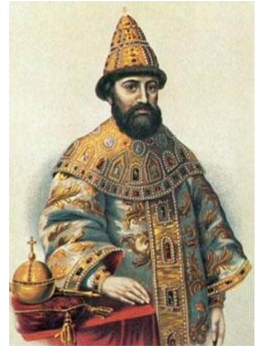
Михаил Федорович (1596-1645)