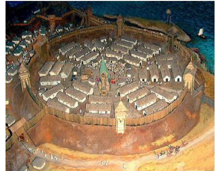
Запорожская Сечь. Реконструкция