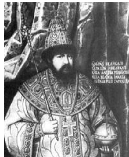
Царь Алексей Михайлович