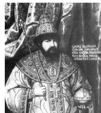
Царь Алексей Михайлович