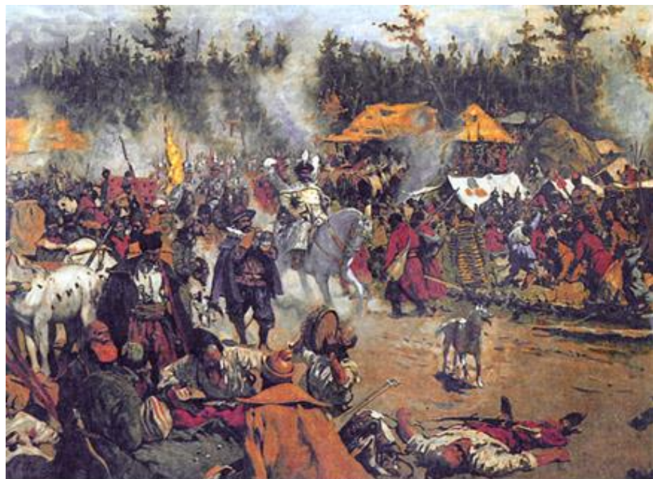
С.В. Иванов. "В смутное время"