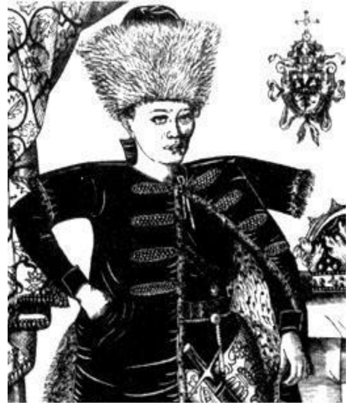
"Дмитрий Самозванец". Гравюра Ф. Снядецкого. XVII в.