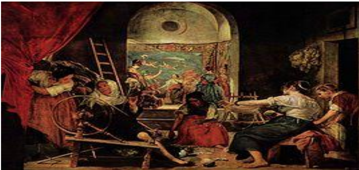
Веласкес , Состязание Афины с Арахной , 1644 — 1648 , Прадо