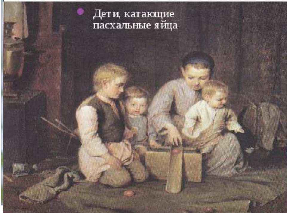
● Дети, катающие пасхальные яйца