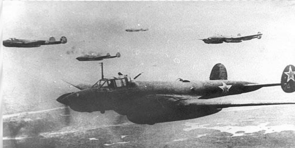
Советские бомбардировщики в боевом полете