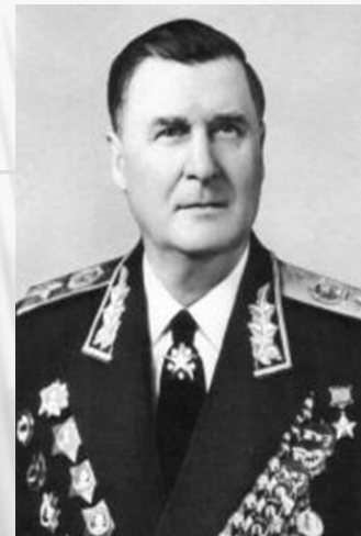
Соколовский В. Д. (1897-1968)