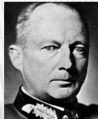
Ганс Гюнтер Клюге (1882 – 1944)