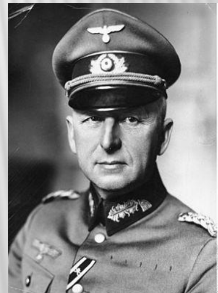
Эрих фон Манштейн (1887-1973)