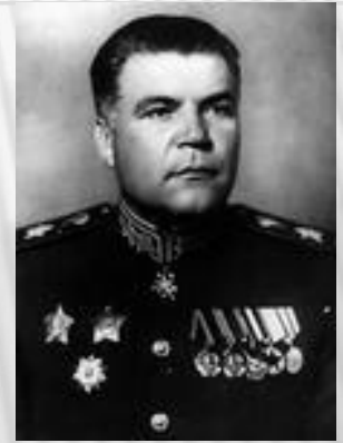
Малиновский Р.Я. (1898-1967)

В ходе контрнаступления на белгородско-харьковском направлении советские войска продвинулись на 140 километров и заняли выгодное положение для перехода в общее наступление с целью освобождения Левобережной Украины и Донбасса.