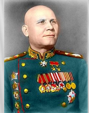
Конев И.С. (1897-1973)

Курская битва обогатила отечественное военное искусство опытом организации глубоко эшелонированной, активной, устойчивой обороны, проведения гибкого и решительного маневра силами и средствами в ходе оборонительных и наступательных действий. Советское командование успешно решило и ряд других проблем в области стратегии, оперативного искусства, тактики.