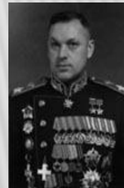
Рокоссовский К.К. (1896 – 1968)