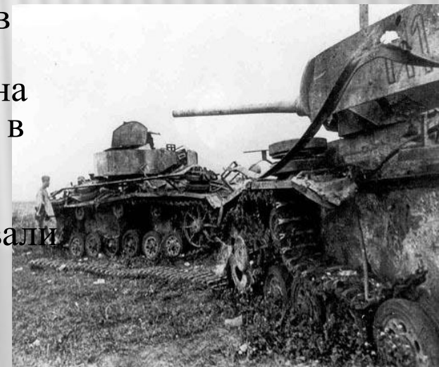
Подбитая немецкая техника