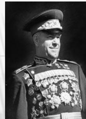
Жуков Г.К. (1896-1974)