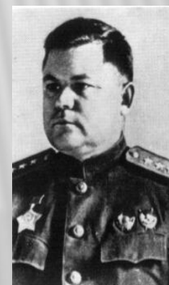
Ватутин Н. Ф. (1901-1944)