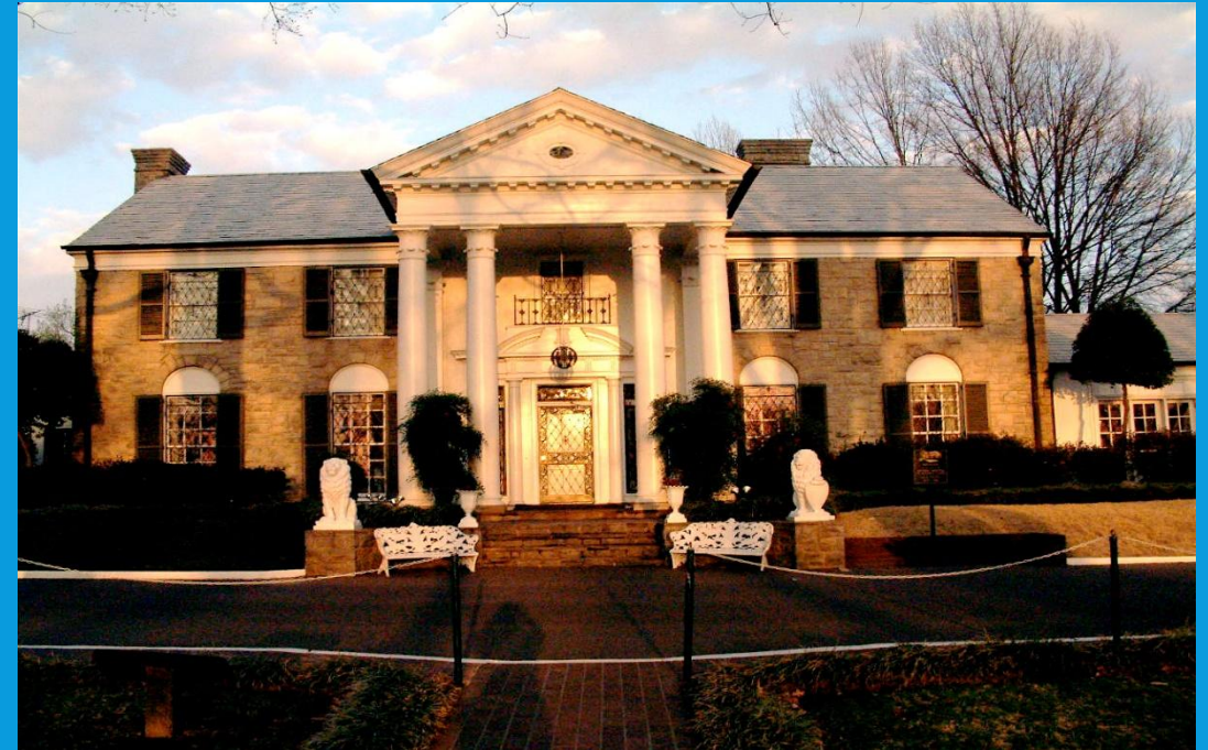
У 1970-і рр. Преслі проводив весь свій вільний час у власному маєтку «Грейсленд».