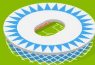
4 Волгоград Арена