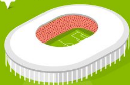
1 Стадион Лужники