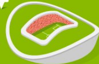
6 Казань Арена