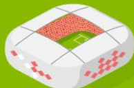
2 Стадион Spartak