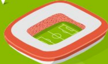
11 Мордовия Арена