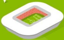
9 Ростов Арена