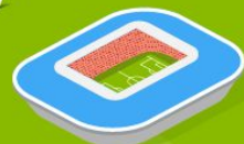
7 Стадион Калининград