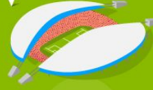
12 Стадион Фишт