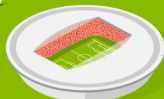
3 Стадион Санкт-Петербург