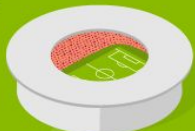
5 Екатеринбург Арена