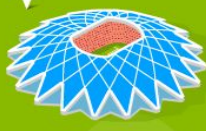
10 Самара Арена