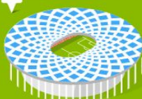
8 Стадион Нижний Новгород