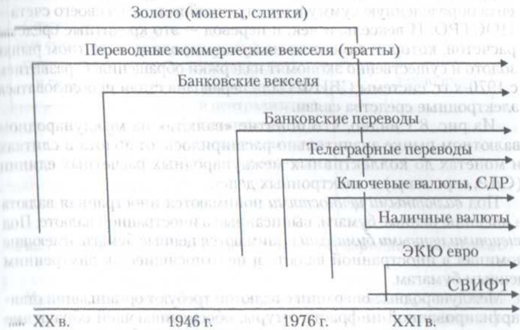
Рис. 8.1. Развитие валютных инструментов сделок на международном валютном рынке