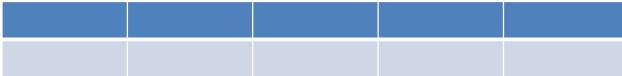
Таблица 2.2.1 - Номинальные размеры

На следующей странице, если таблица продолжается: