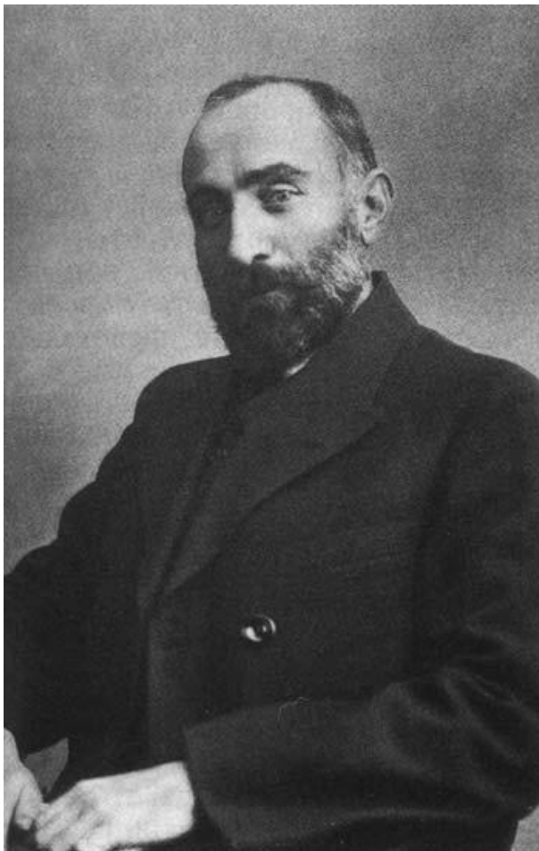
Чхеидзе Николай Семенович