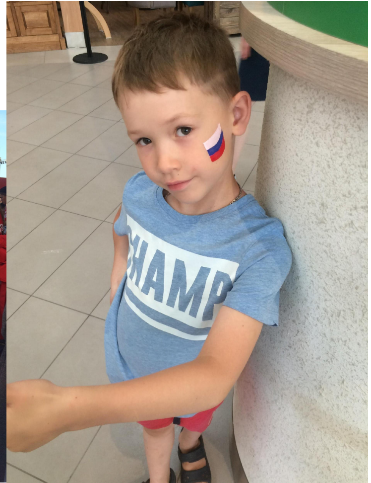
На матче Россия-Испания