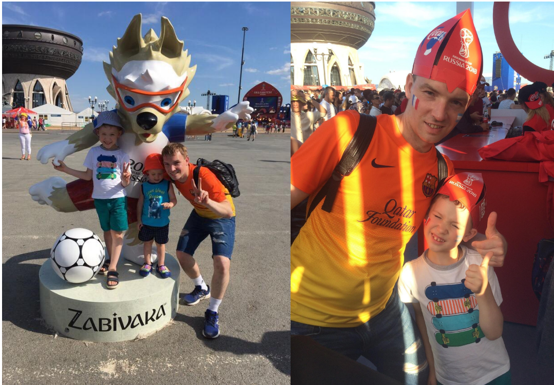
На матче Франция-Аргентина