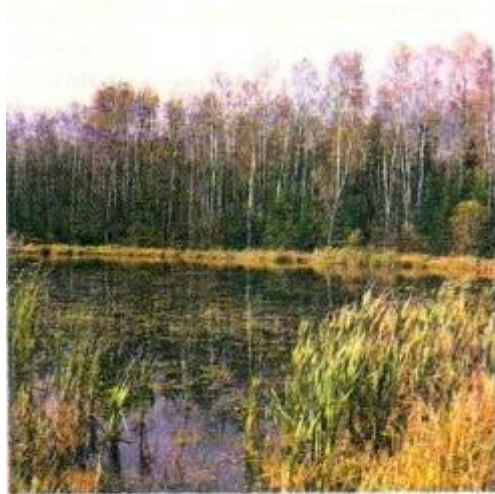
Болото в тайге