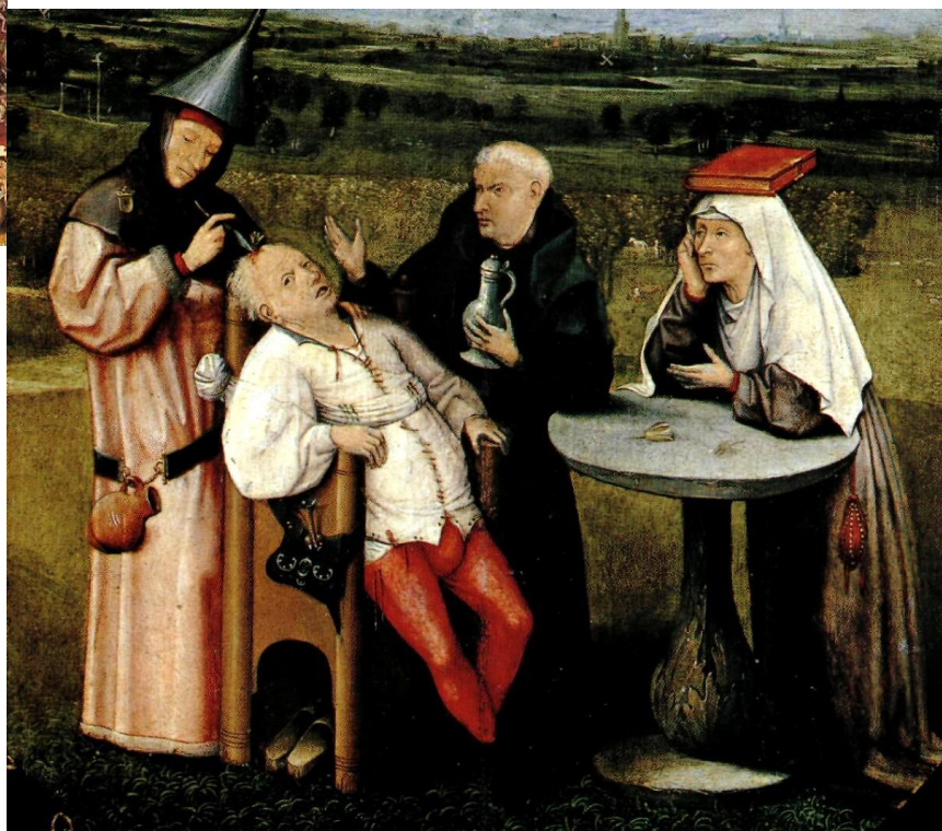
КАМЕНЬ ГЛУПОСТИ ИЕРОНИМ БОСХ