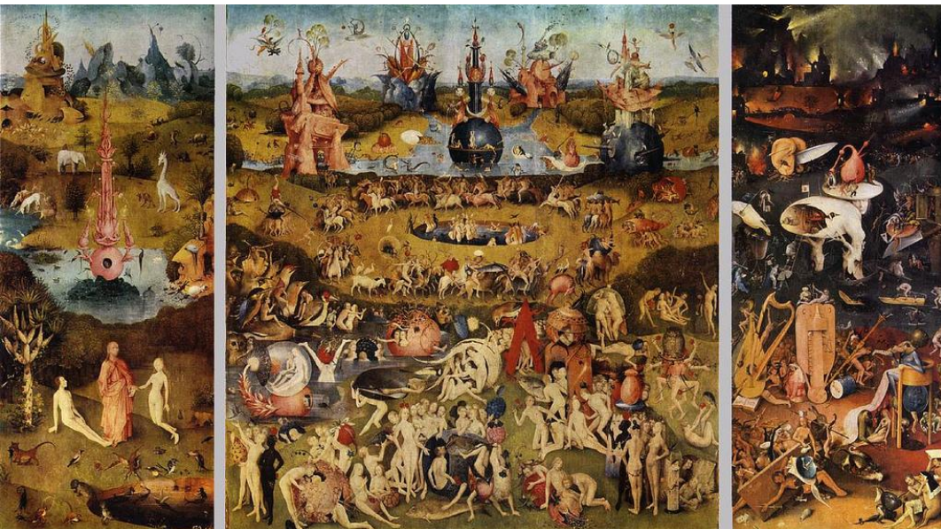
САД ЗЕМНЫХ НАСЛАЖДЕНИЙ ИЕРОНИМ БОСХ