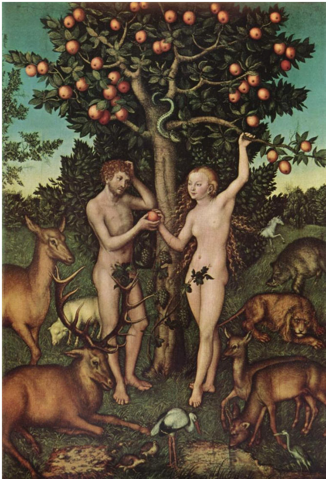
АДАМ И ЕВА В РАЙСКОМ САДУ ЛУКАС КРАНАХ