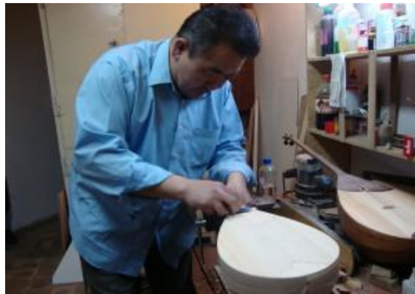
Музыкалық аспаптар жасау