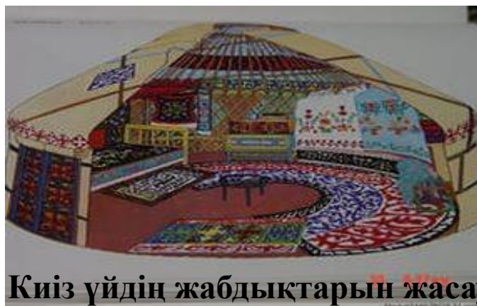
Киіз үйдiң жабдықтарын жасау