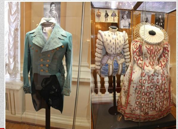
Костюмы и декорации