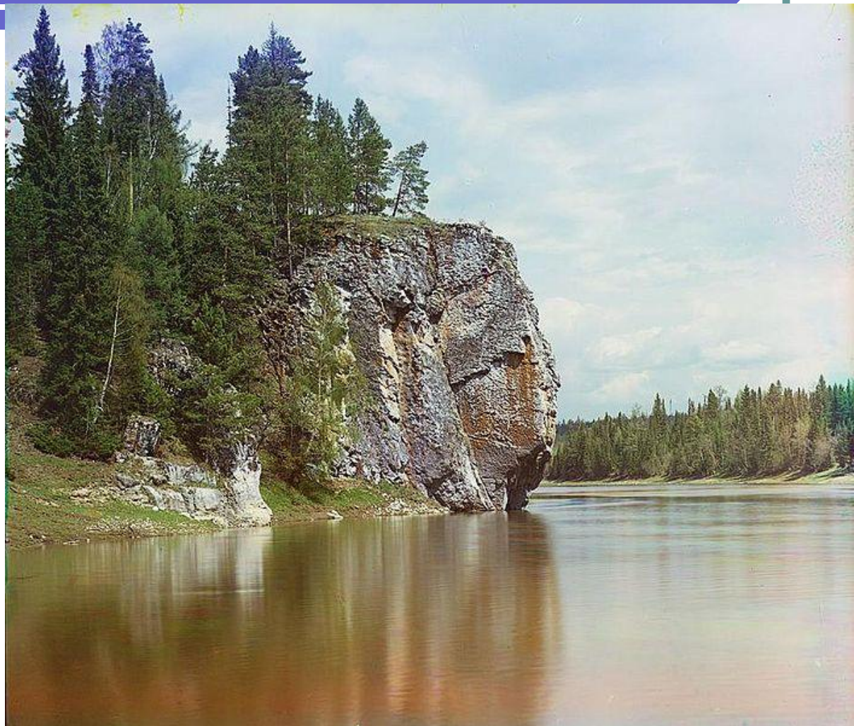
Чусовая приток Камы