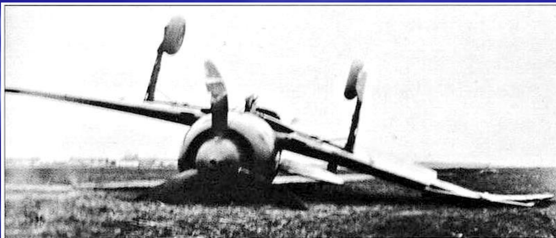
Ла-7, в кабине которого 1 ноября 1944 г. погиб майор А.Ф.Клубов.