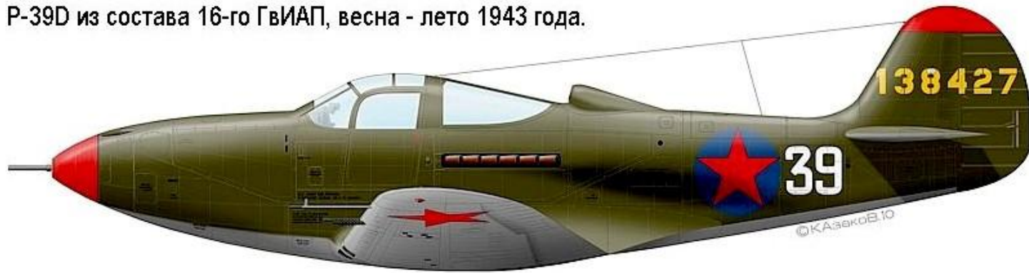
P-39D из состава 16-го ГвИАП, весна - лето 1943 года.