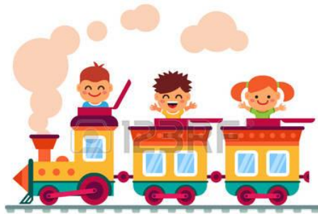
Kids on the Train