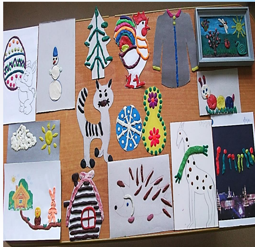
Работы детей кружка «Пластилиновая страна»