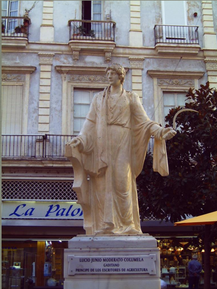
LUCIO JUNIO MODERATO COLUMELA GADITANO PRINCE DE LOS ESCRITORES DE AGRICULTURA