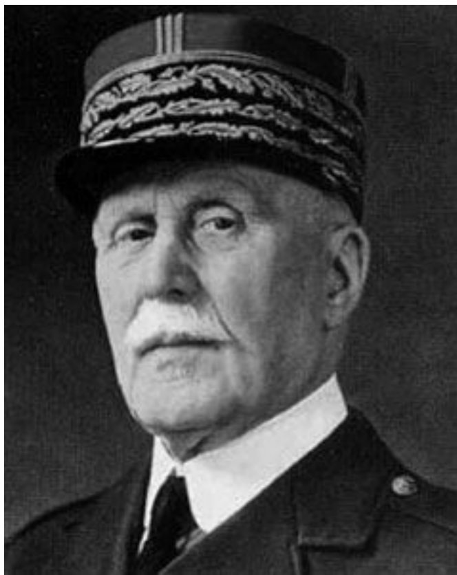
Анри Филипп Петэн (1856-1951)