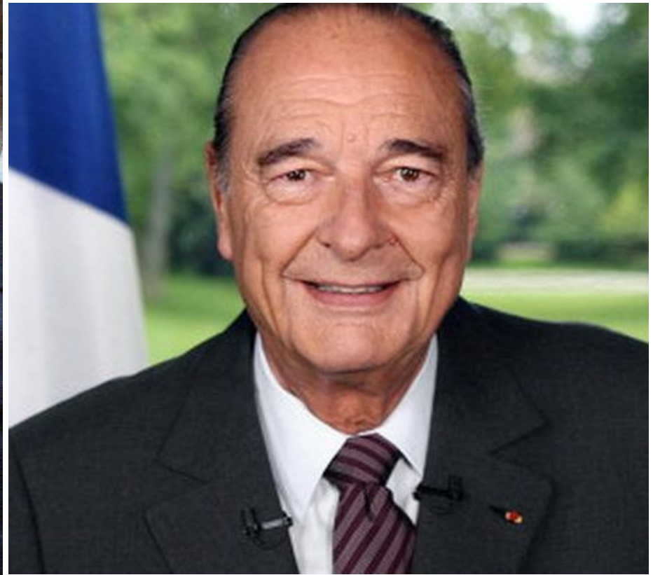
Жак Ширак (р. 1932)