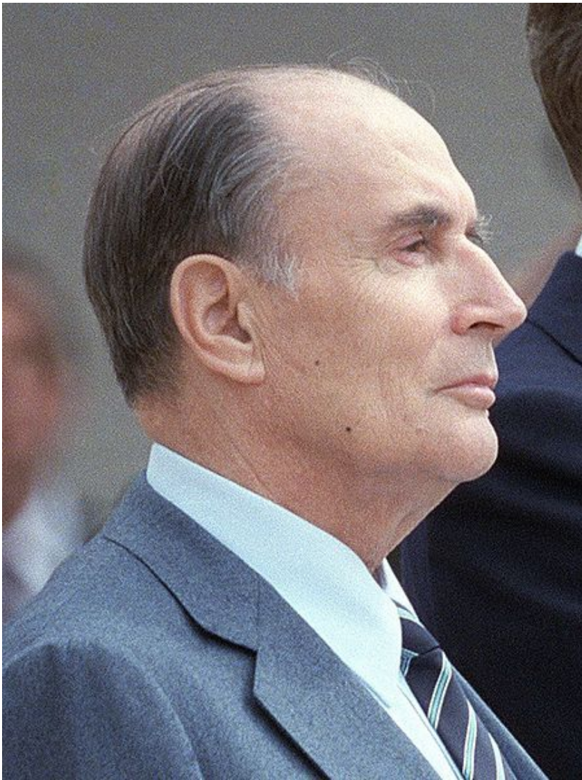
Франсуа Миттеран (1916-1996)