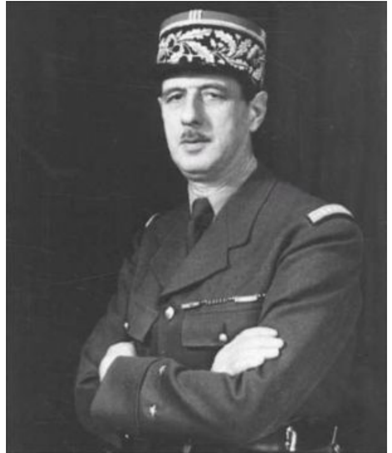
Шарль де Голль (1890-1970)