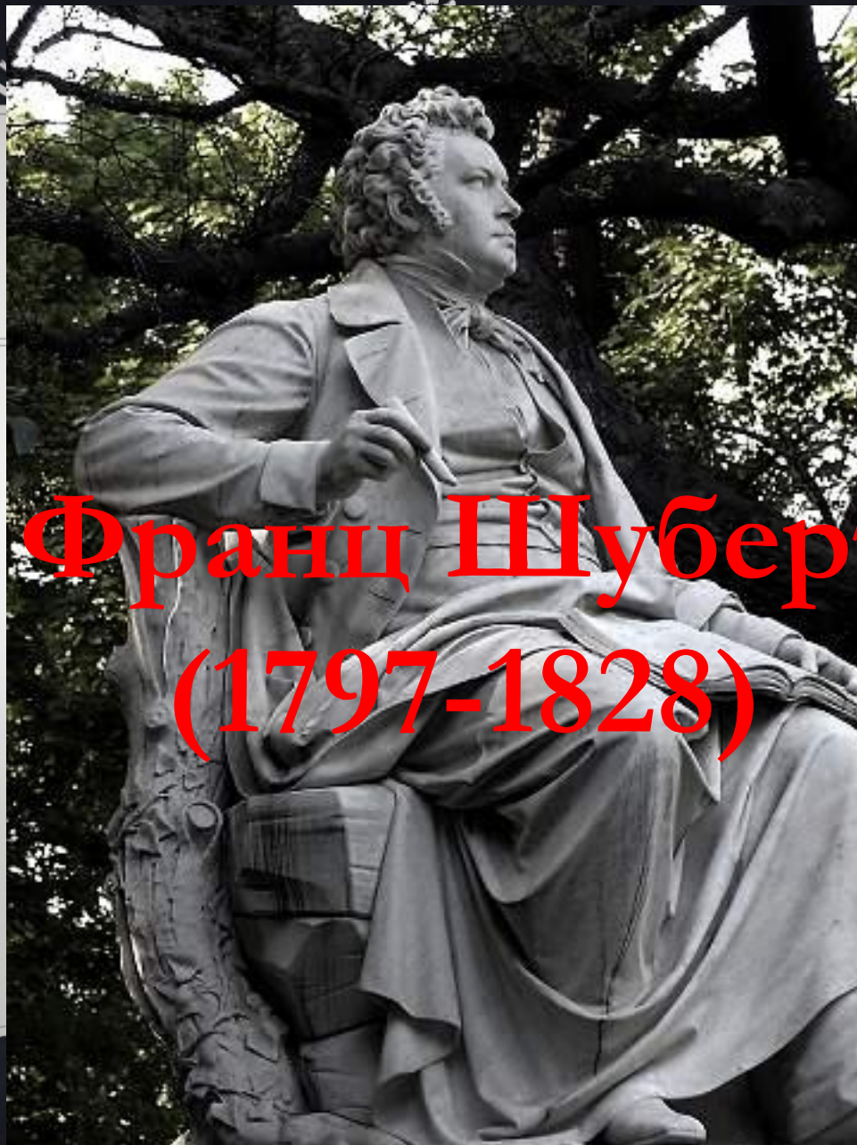
Франц Шуберт (1797-1828)