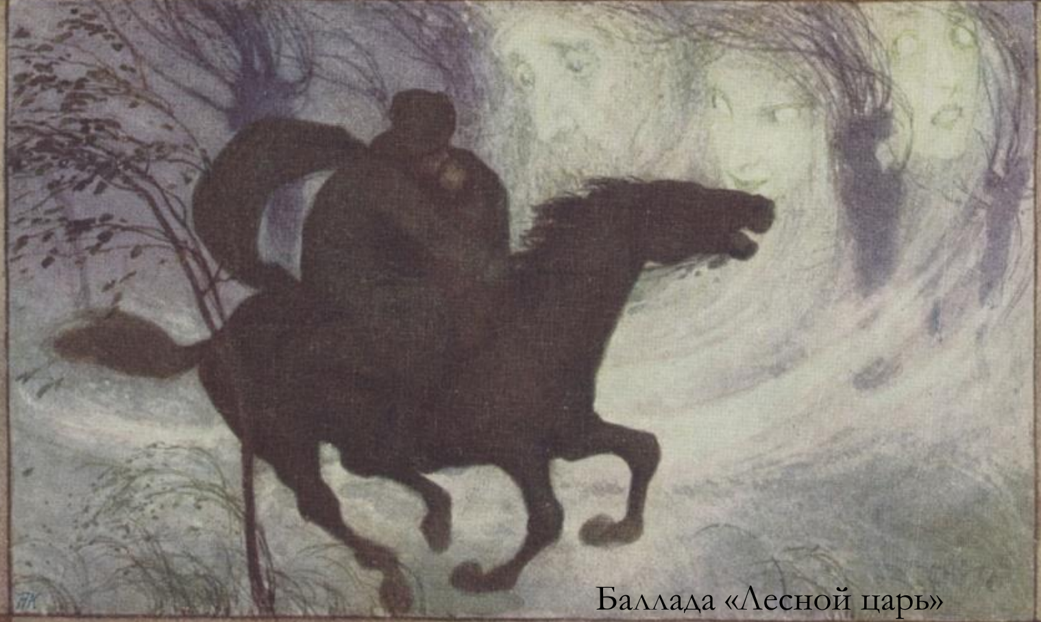
Баллада «Лесной царь»