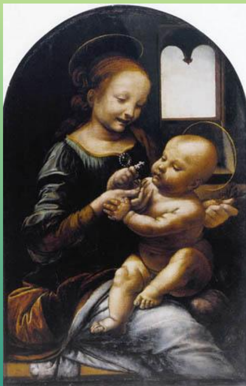
Леонардо да Винчи. Мадонна Бенуа.