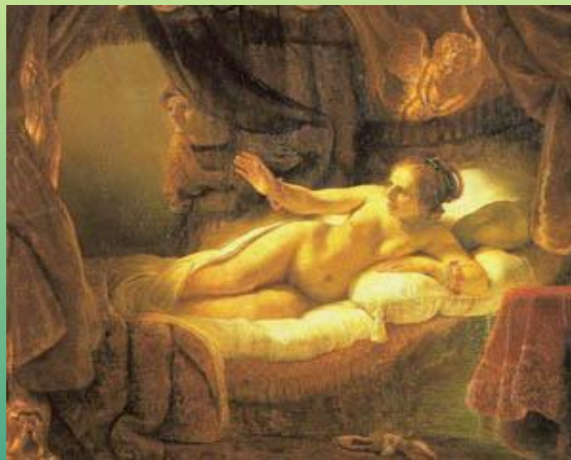
Даная. 1636 г.

Рембрандт ван Рейн (1606—1669). В Эрмитаже хранится двадцать шесть картин великого голландца