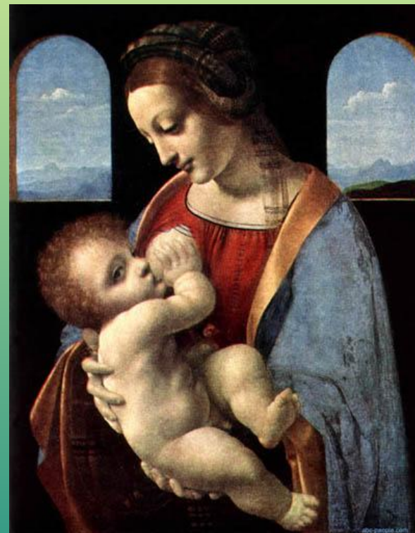
Леонардо да Винчи. Мадонна Литта.