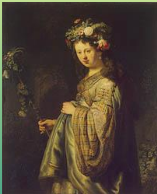
Флора. 1634 г.