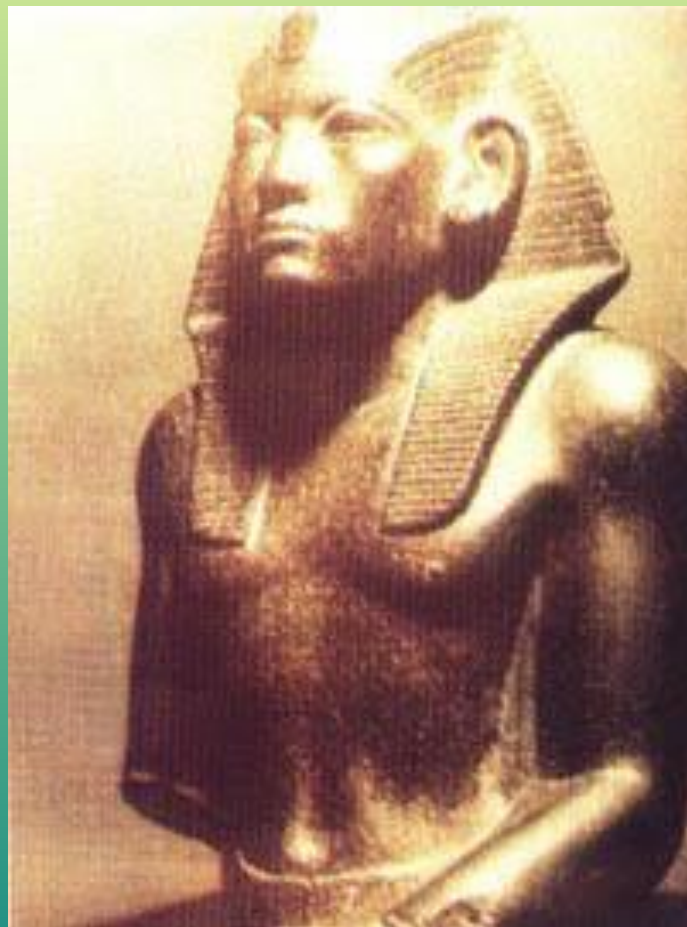
Аменхотеп III. XIX в. до н.э.