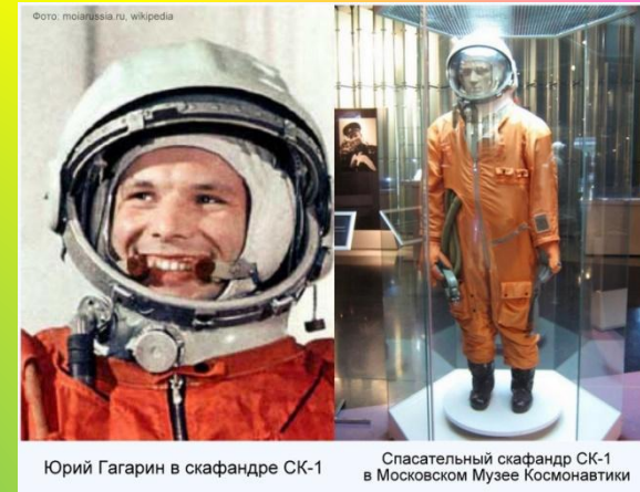
Юрий Гагарин в скафандре СК-1