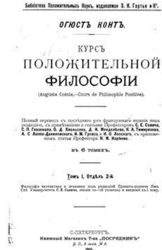
«Курс позитивной философии» (1830-1842)