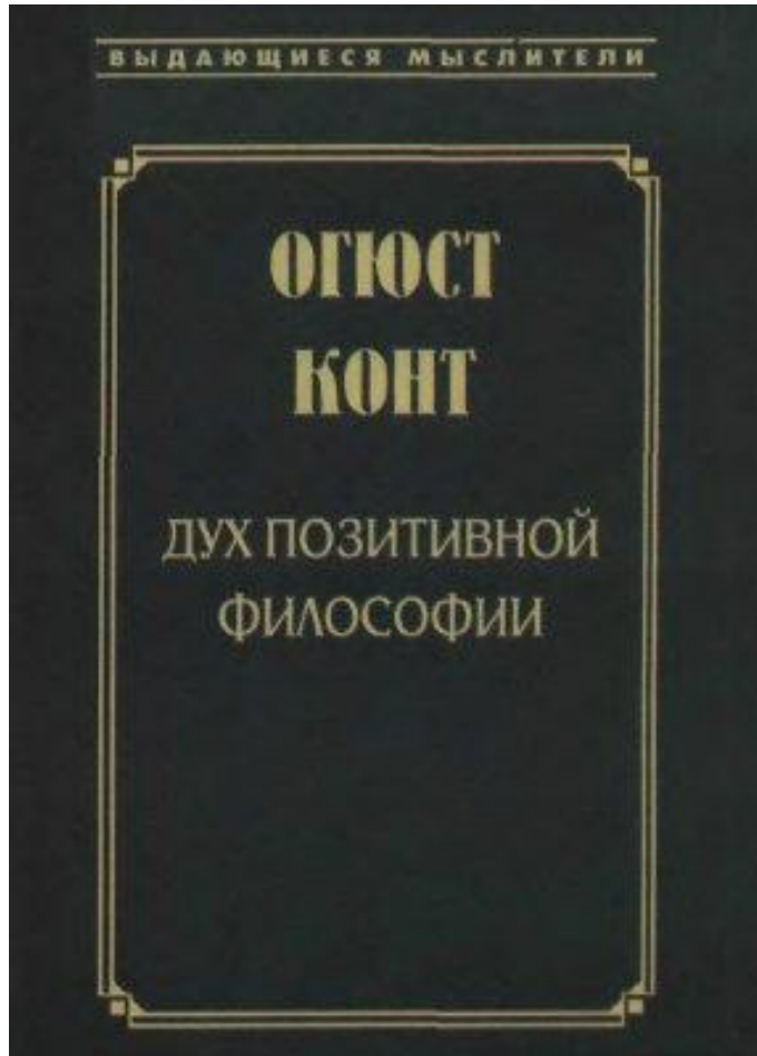
«Дух позитивной философии» (1844)