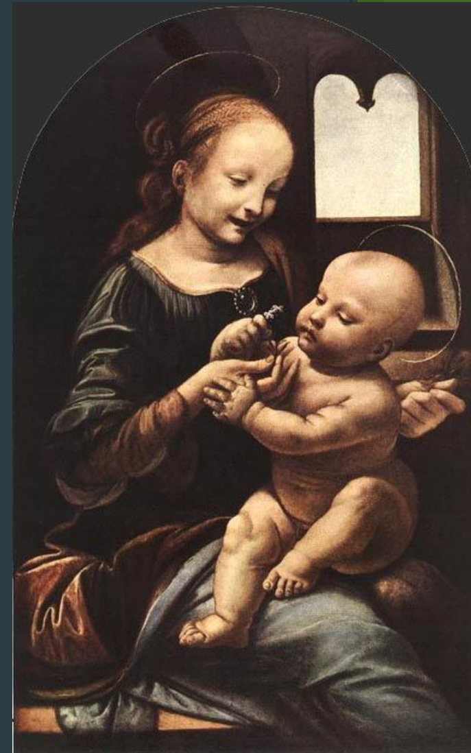
Мадонна Бенуа (Мадонна с цветком)