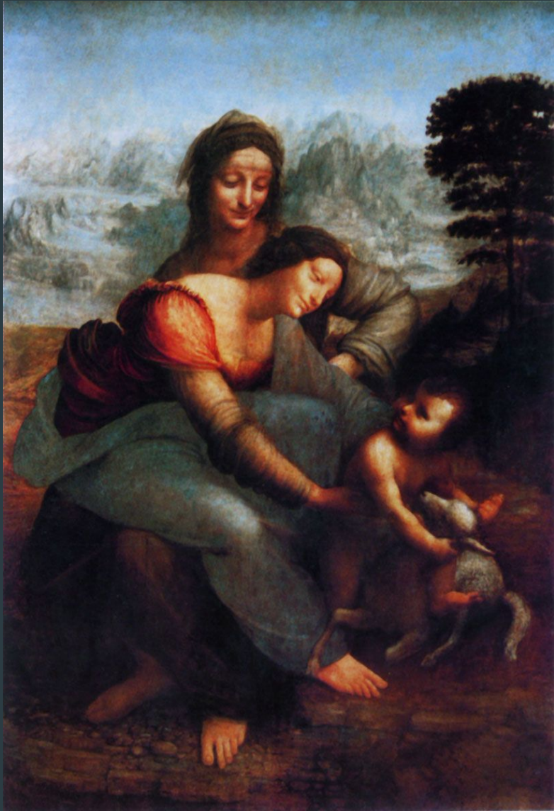
Св. Анна с Марией и младенцем Христом