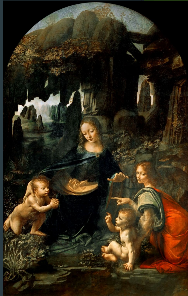
Мадонна в скалах