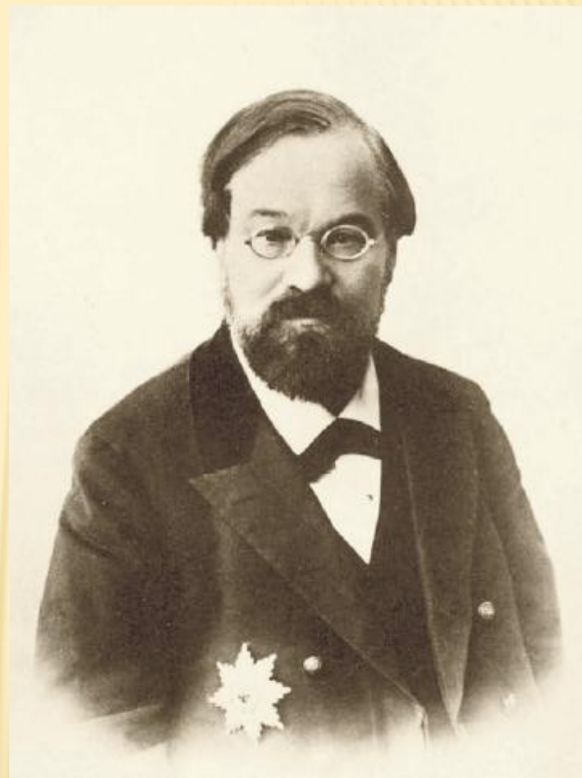
Николай Васильевич Бугаев.

Родился в семье профессора Николая Васильевича Бугаева (1837—1903), известного математика и философа, президента Московского математического общества (1891—1903), наиболее яркого представителя Московско й философско-математической школы.