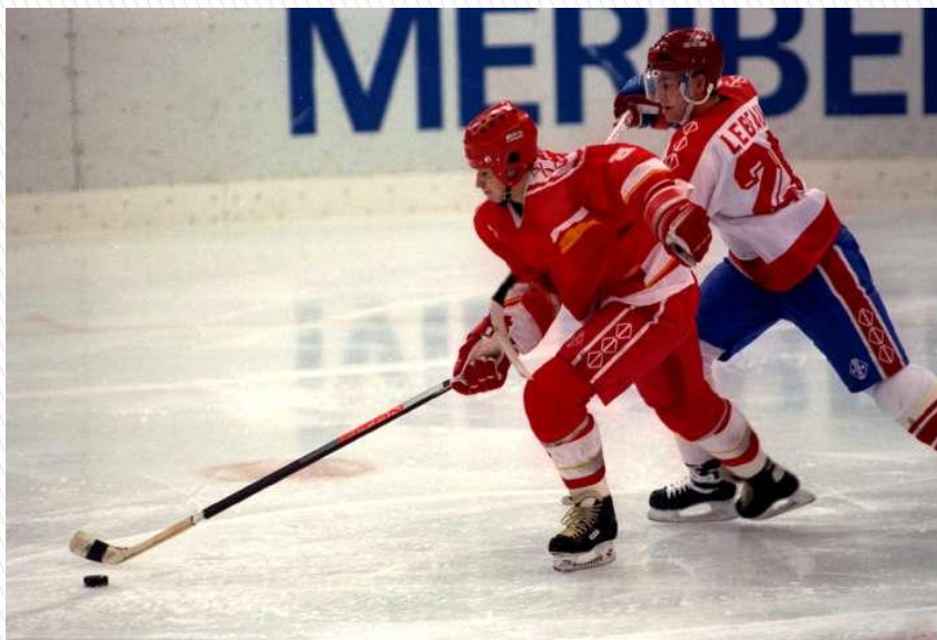
Хоккей с шайбой

Он играет на коньках. Клюшку держит он в руках. Шайбу этой клюшкой бьёт. Кто спортсмена назовёт? (Хоккеист)