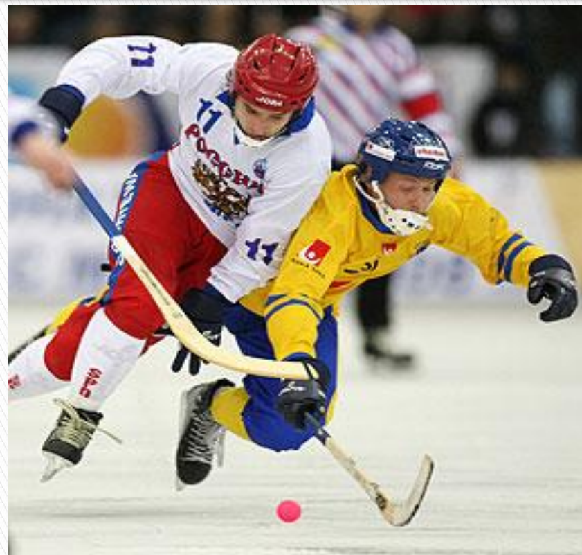
Хоккей с мячом