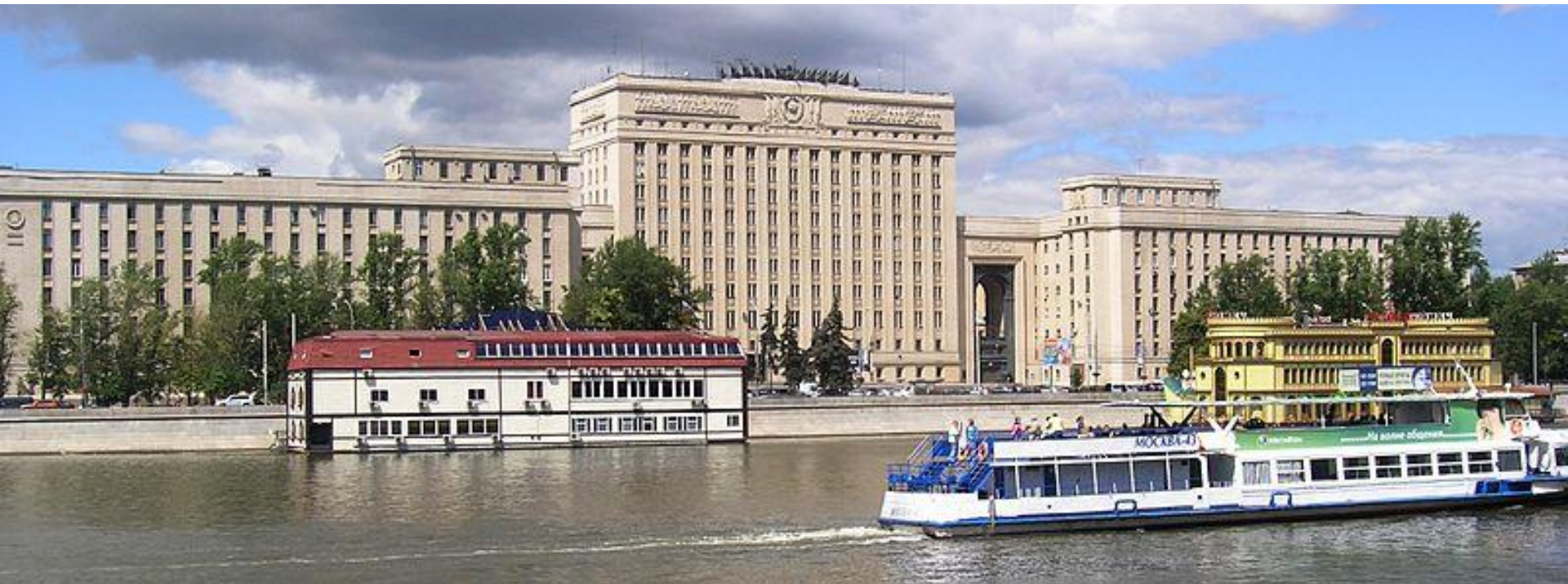
Здание Главного штаба Сухопутных войск (Фрунзенская набережная, г. Москва)