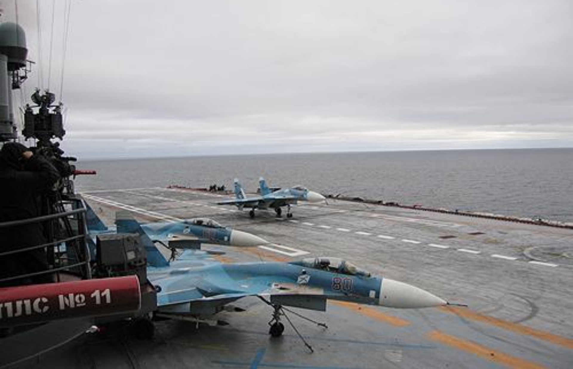
Су-33 на палубе тяжелого авианесущего крейсера «Адмирал флота Советского Союза Кузнецов»