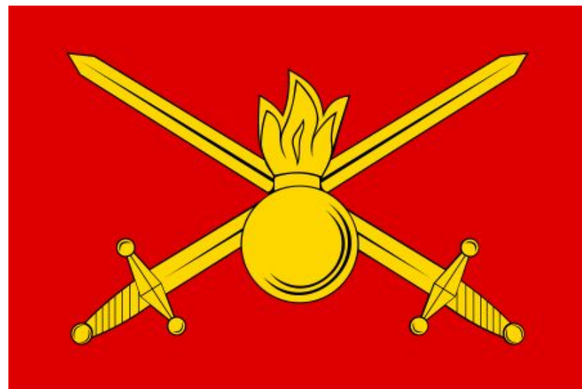
Эмблема и флаг Сухопутных войск Российской Федерации