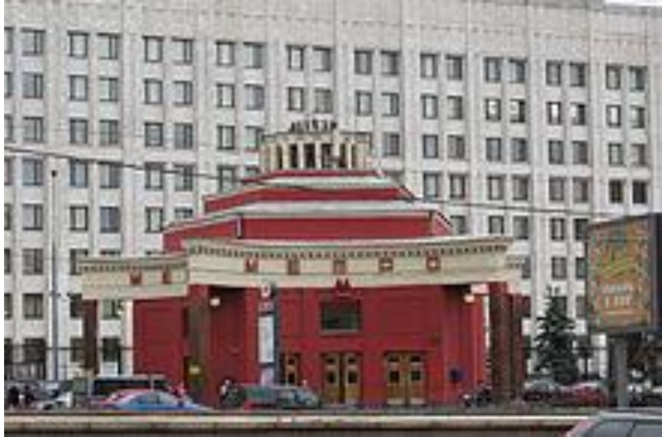
Вестибюль станции «Арбатская» на фоне нового здания ГШ