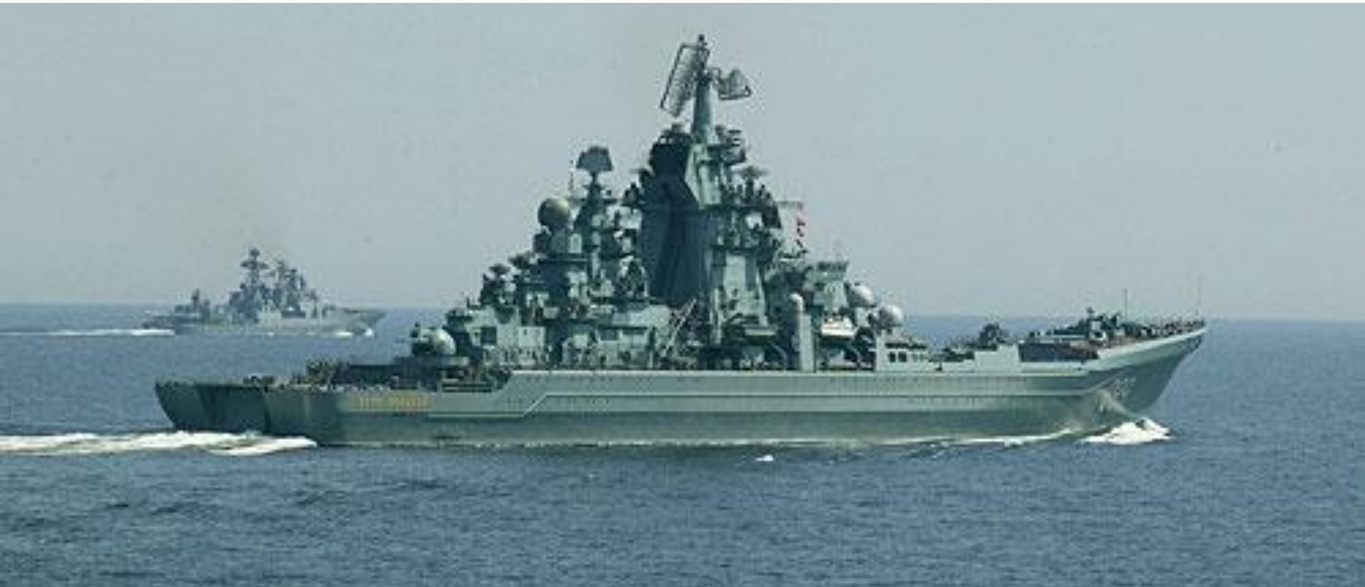
Ракетный крейсер Петр Великий во время учений.

Надводные силы – предназначены для обеспечения скрытного выхода в океан и развёртывания подводных сил и их возвращения на базы, для поиска и уничтожения подводных лодок, борьбы с надводными кораблями, высадки морских десантов, обнаружения и обезвреживания морских мин.