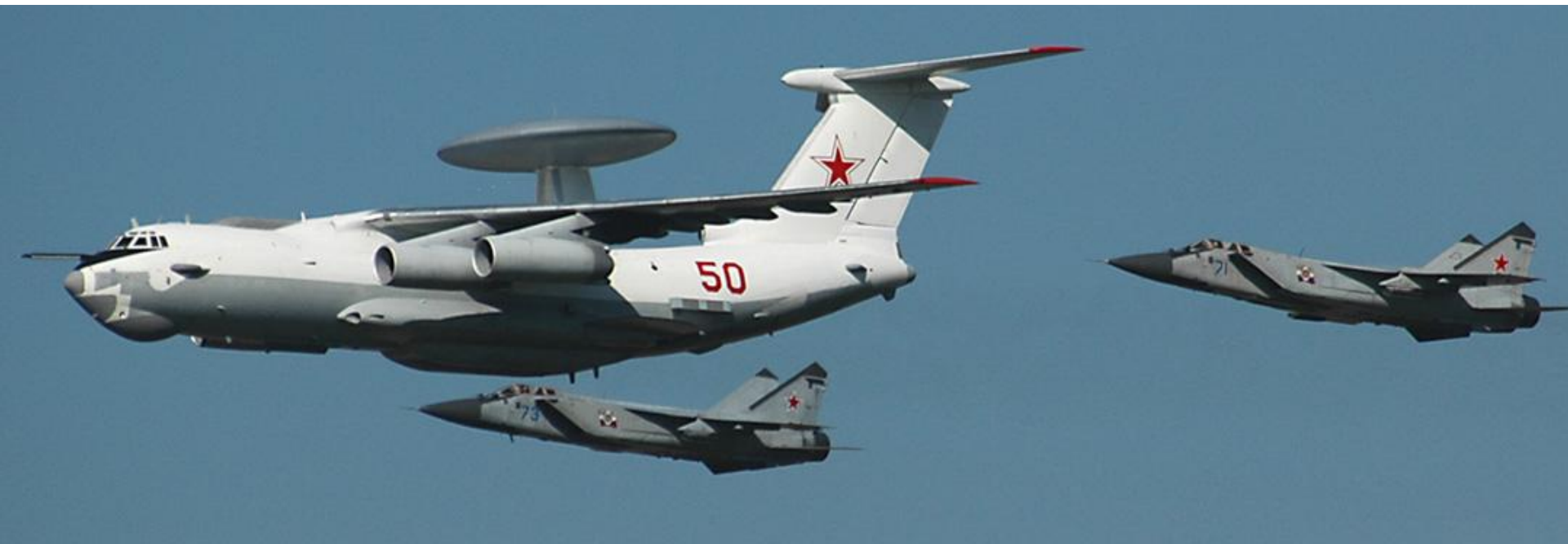
А-50 — самолёт дальнего радиолокационного обнаружения и МИГ-31

Специальная авиация - предназначена для решения широкого спектра задач: дальнего радиолокационного обнаружения, ведения радиоэлектронной борьбы, разведки, обеспечения управления и связи, дозаправки самолетов в воздухе, ведения радиационной, химической и инженерной разведки, эвакуации раненых и больных, поиска и спасения летных экипажей и т. д.