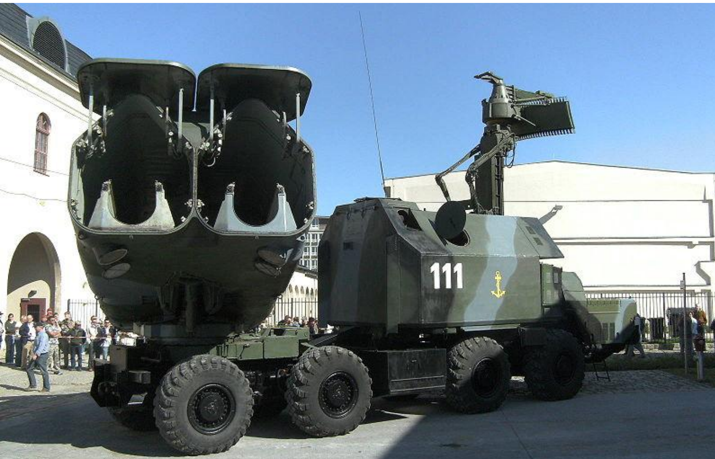
Самоходная ПУ берегового противо корабельного ракетного комплекса «Рубеж»

Береговые войска - предназначены для защиты пунктов базирования сил ВМФ, портов, важных участков побережья, островов, проливов от нападения кораблей и морских десантов противника. Состоят из частей ракетных войск и артиллерии, морской пехоты и специальных кораблей береговой обороны.