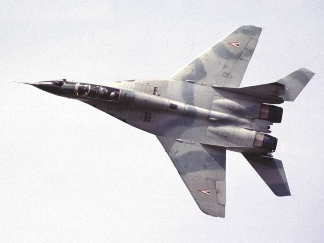
Фронтовой истребитель МиГ-29УБТ