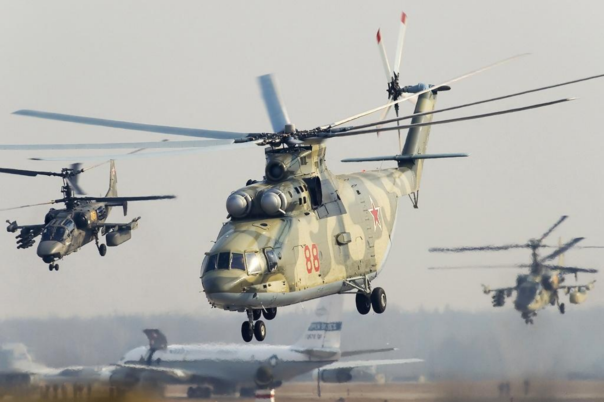
Многоцелевой транспортный вертолет МИ-26