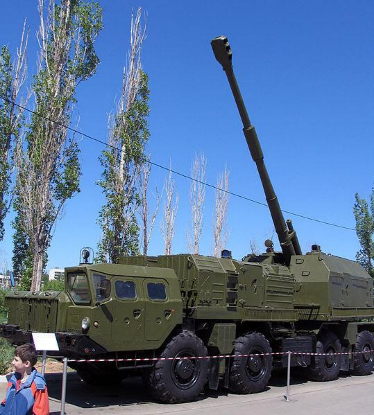
Самоходная артиллерийская установка берегового артиллерийского комплекса АК-222 "Берег" на колёсном шасси МАЗ-543М