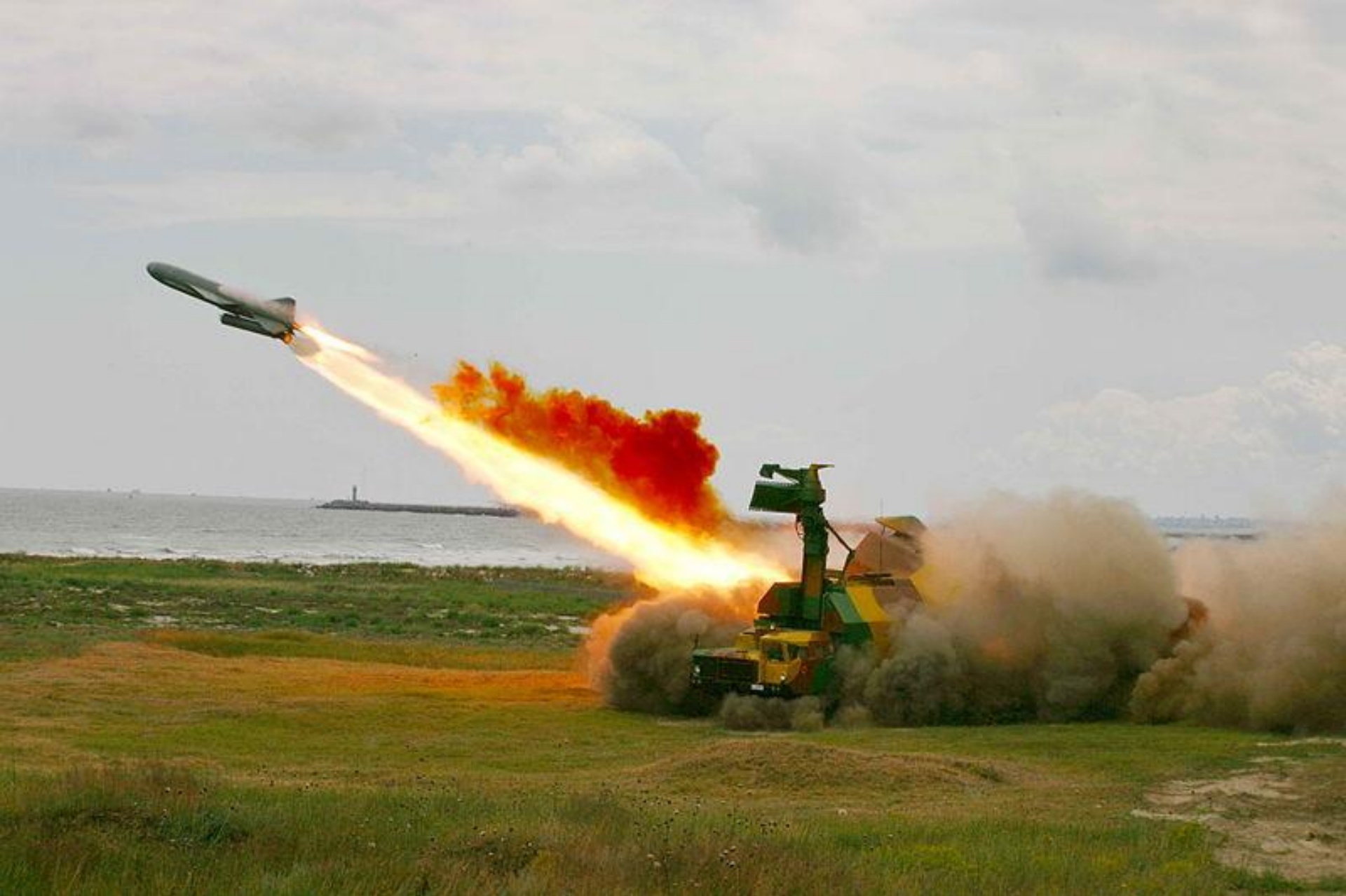
Пуск крылатой ракеты ракетного комплекса «Рубеж»