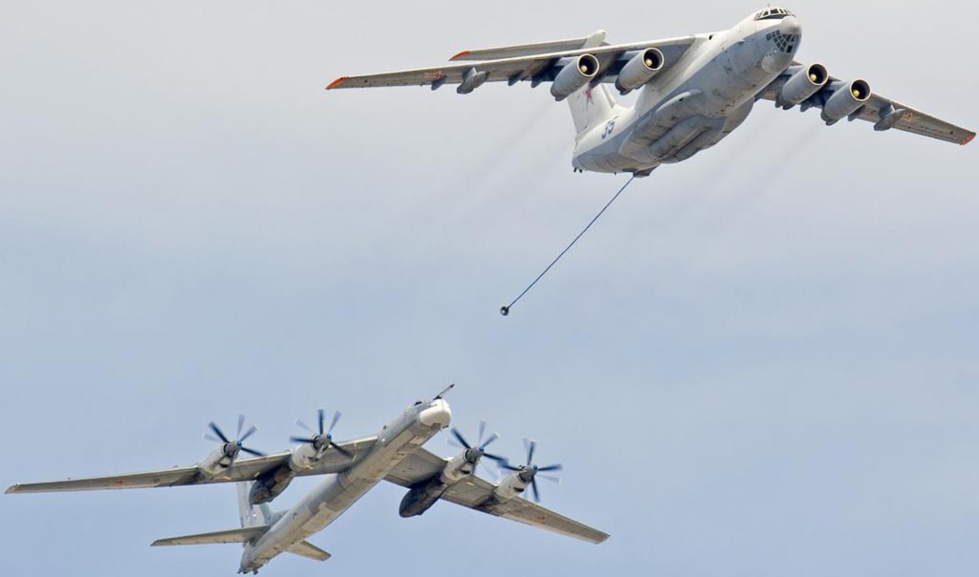
Самолёт-топливозаправщик Ил-78М заправляет Ту-95