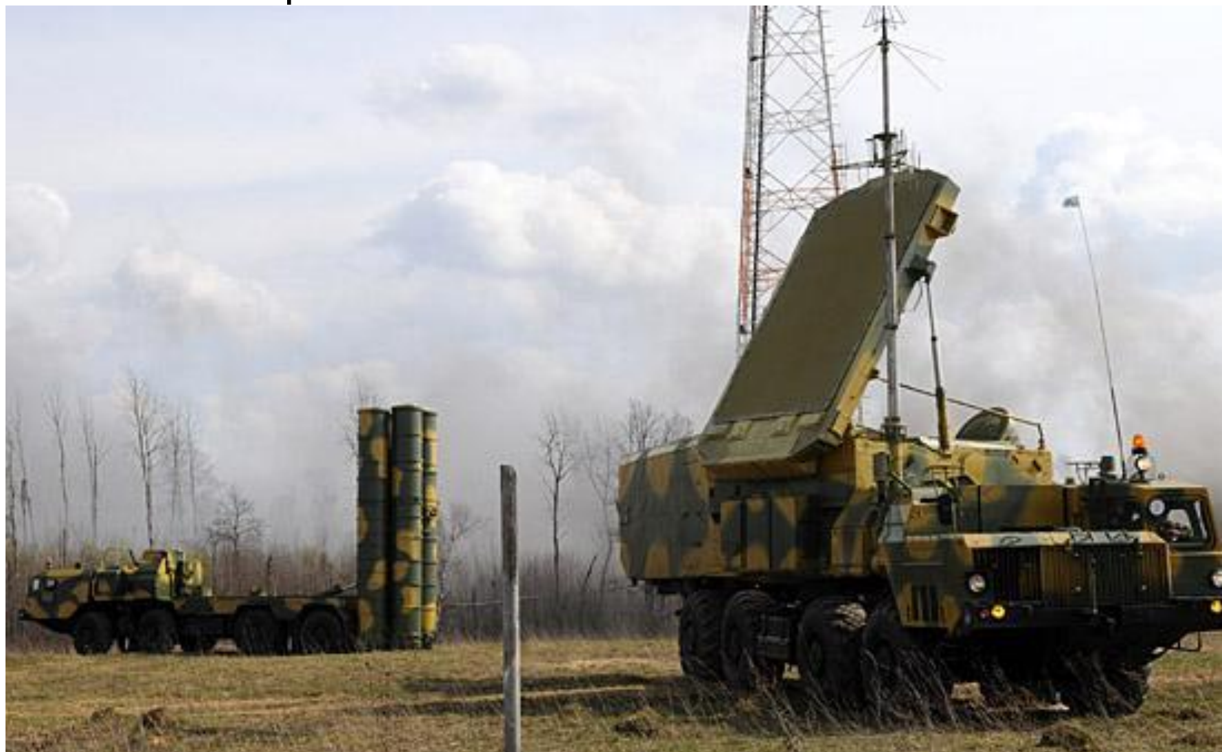
Зенитный ракетный комплекс «С-300 ПМУ1»

Зенитно-ракетные войска - предназначены для защиты от средств воздушного нападения важных административных и экономических районов и объектов России.