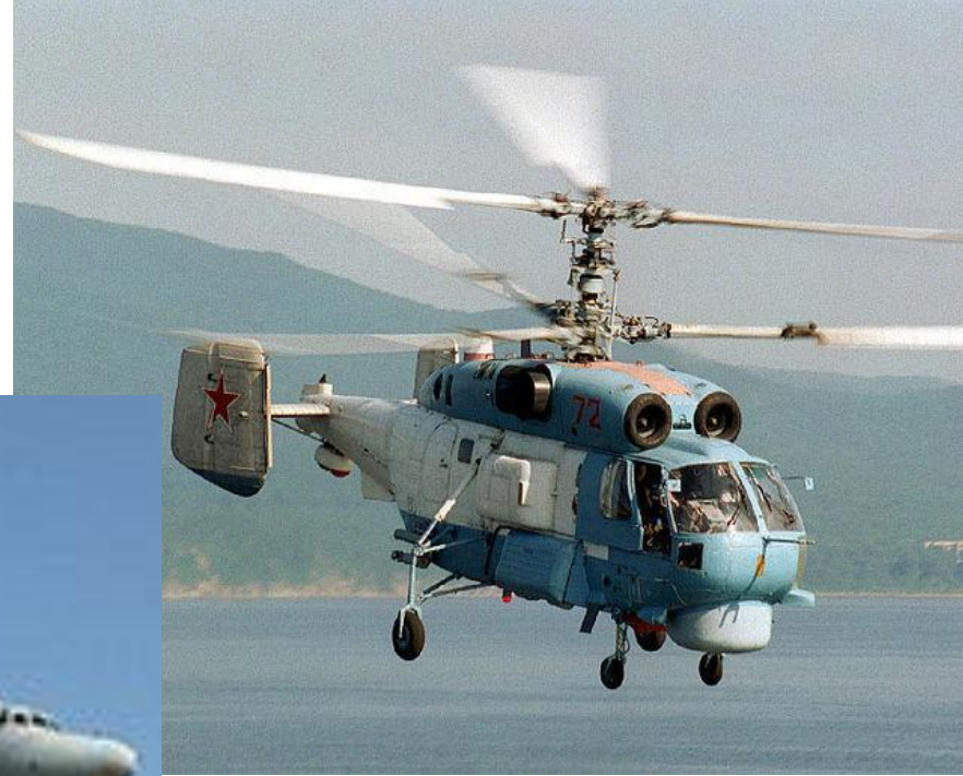
Поисково-спасательный вертолет КА-27ПС

Морская авиация - предназначена для поиска и уничтожения подводных лодок, уничтожения корабельных группировок, конвоев, десантов противника в море и в базах, ведения радиолокационной разведки. Выделяют палубную и береговую авиацию.