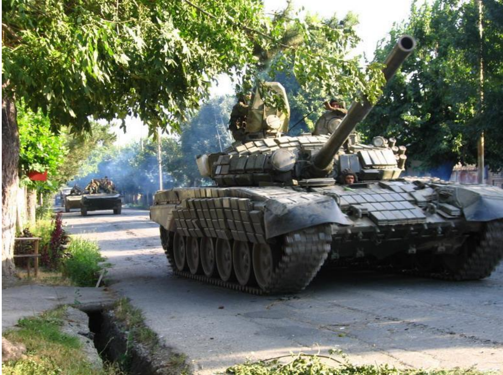
Танк Т-90 в Южной Осетии.