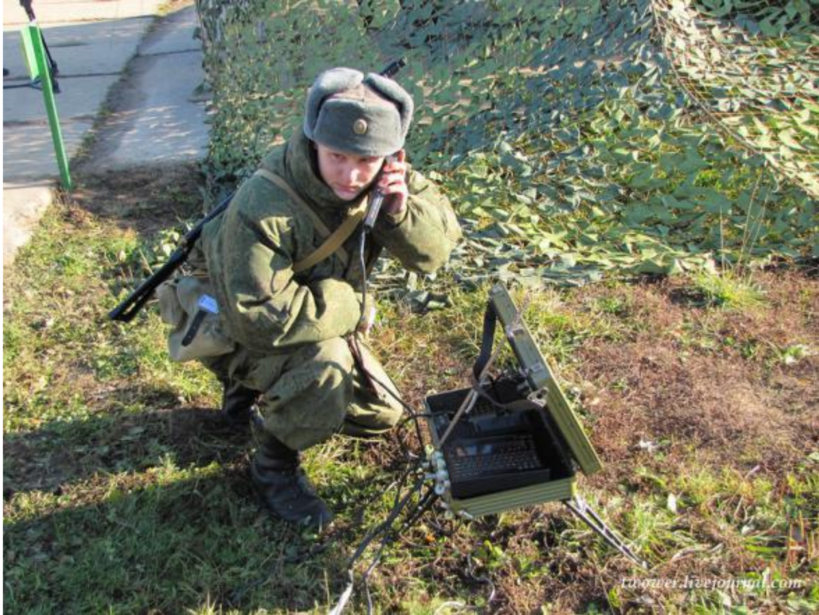
Войска связи ( станция спутниковой связи «Барьер»)