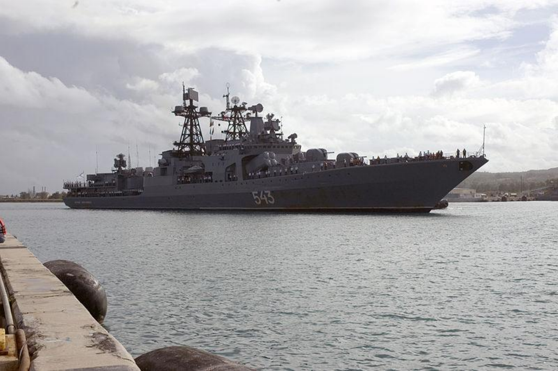
Большой противолодочный корабль Маршал Шапошников .