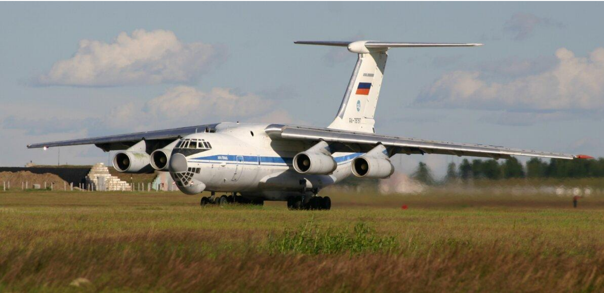
Военно-транспортный самолет ИЛ-76МД

Военно-транспортная авиация – предназначена для перевозки войск, боевой техники и грузов, а также выброску воздушных десантов.