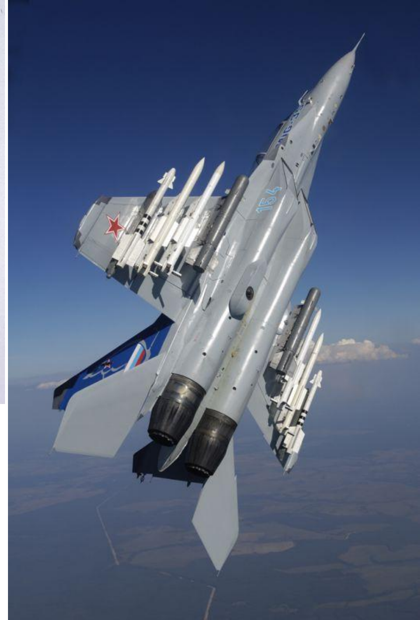
Много-целевой истребитель бомбардировщик МиГ-35