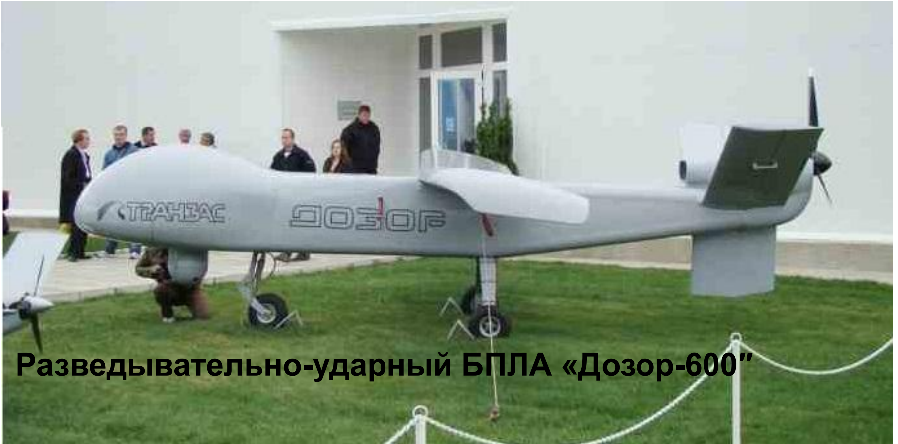
Разведывательно-ударный БПЛА «Дозор-600»

Армейская авиация - предназначена для авиационной поддержки Сухопутных войск путем поражения наземных бронированных объектов противника на переднем крае и в тактической глубине, а также для повышения мобильности войск. Части и подразделения армейской авиации выполняют огневые, десантно-транспортные, разведывательные и специальные боевые задачи.