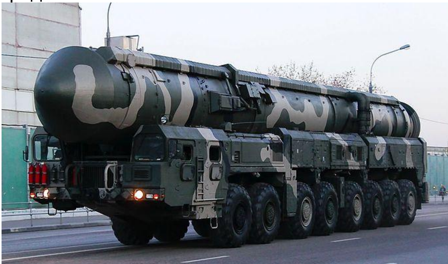
Подвижный грунтовый ракетный комплекс «Тополь М»

На вооружении РВСН состоят межконтинентальные баллистические ракеты наземного базирования с ядерными боезарядами.