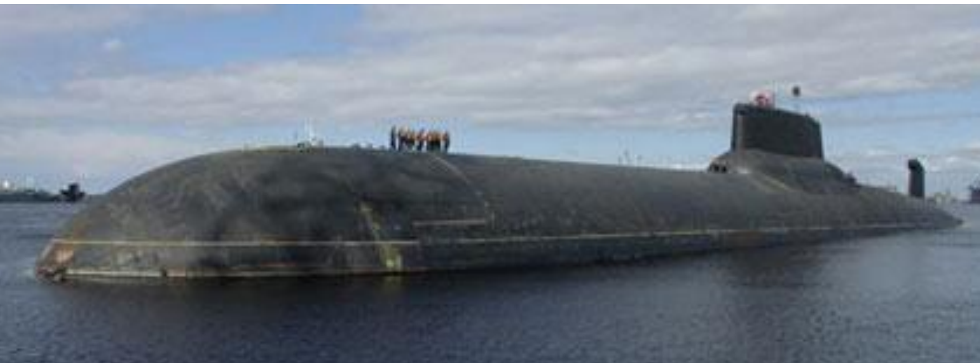
Стратегическая подводная лодка «Дмитрий Донской»

Подводные силы – основное ударное средство ВМФ, предназначены для поражения крупных экономических, военно-стратегических центров и группировок противника, нанесения ударов по группировкам надводных кораблей, в том числе по авианосцам, корабельным ударным группировкам, десантным отрядам и конвоям.