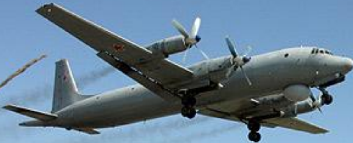
Дальний самолет противолодочной обороны ИЛ-38