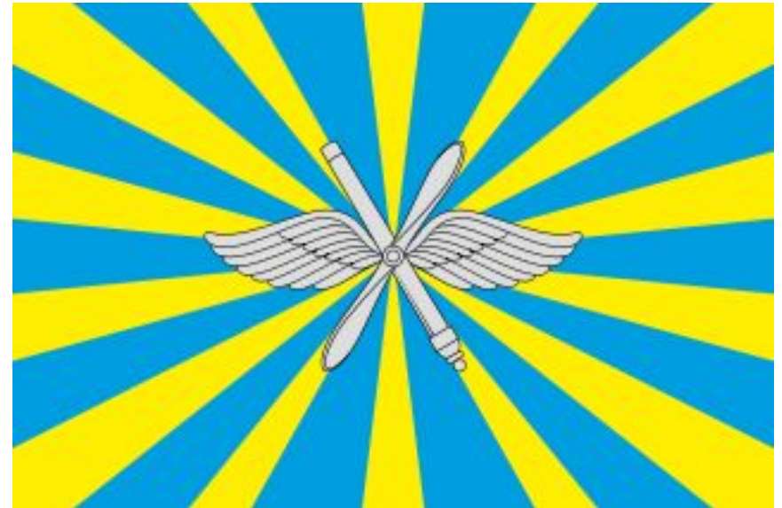
Эмблема и флаг воздушно-космических сил