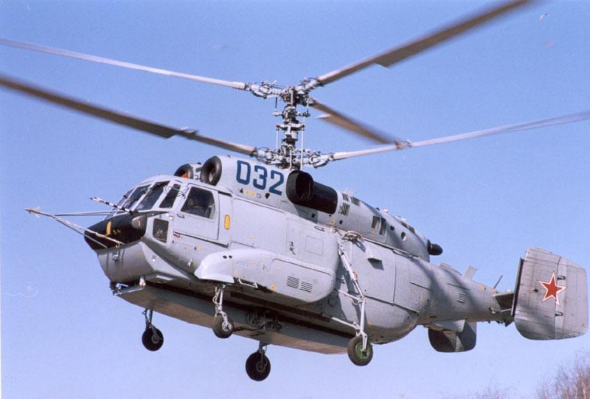
Вертолёт радиолокационного дозора Ка-31