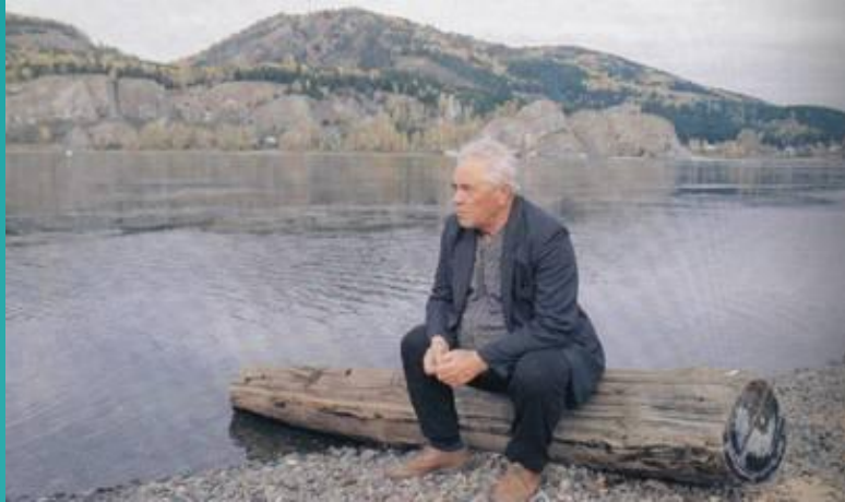
На берегу Енисея