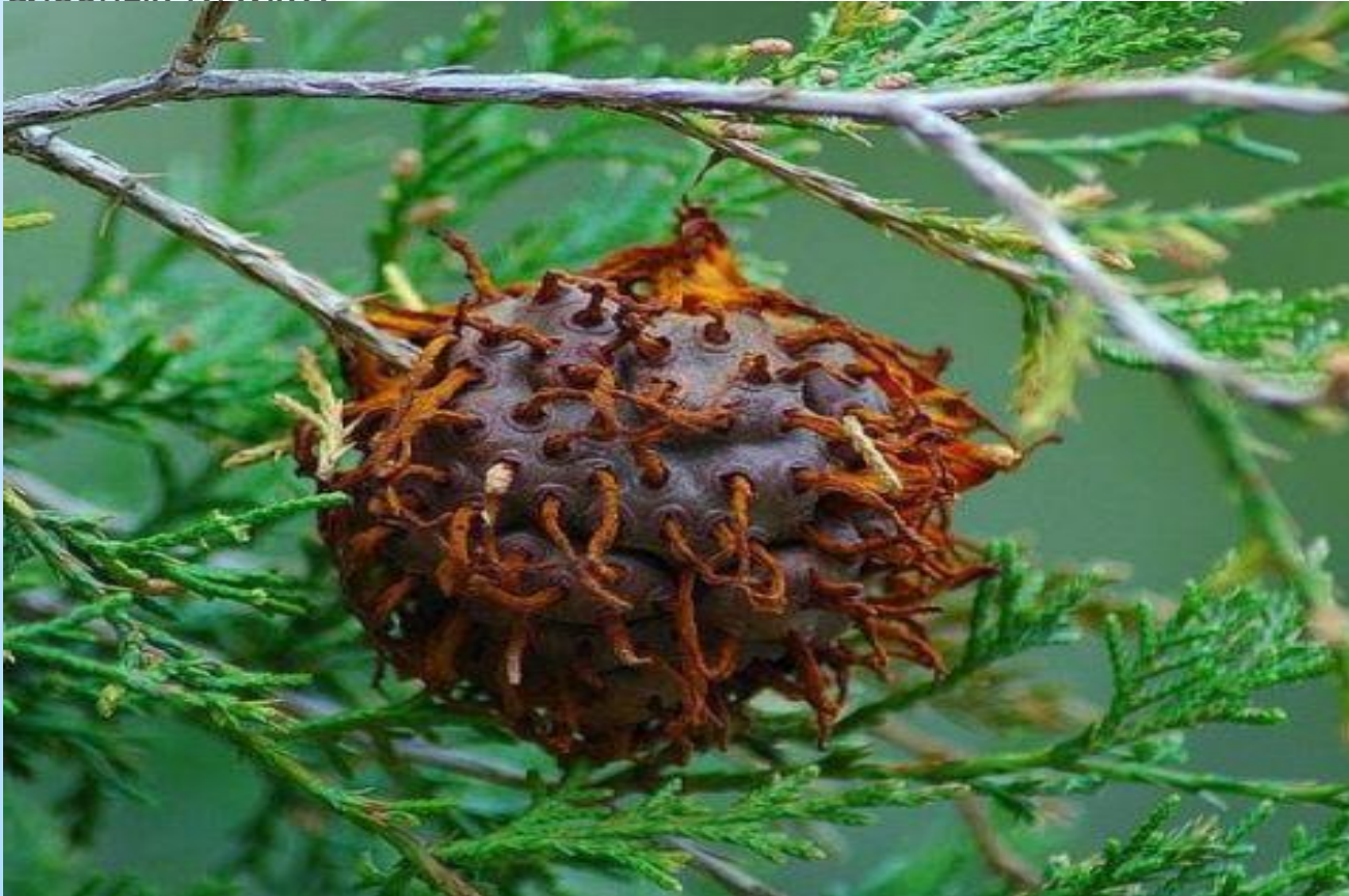
КЕДРОВО- ЯБЛОЧНЫЙ ГНИЮЩИЙ ГРИБ

КЯГГ – грибковая инфекция, преобразующая яблочные и кедровые плоды до неузнаваемости. Про эту мерзость хоть щас можно снимать фильмы ужасов: инфицированные плоды буквально за несколько месяцев превращаются в омерзительных чудовищ. Вот как это происходит: из крошечной споры грибка развивается внушительных размеров шаровидное тело – от 3.5 до 5 сантиметров в диаметре, при намокании эта мерзость расслаивается, образуя мерзопакостные усики. В результате, кедровые орешки и яблочки превращаются в маленьких злобных Ктулху.