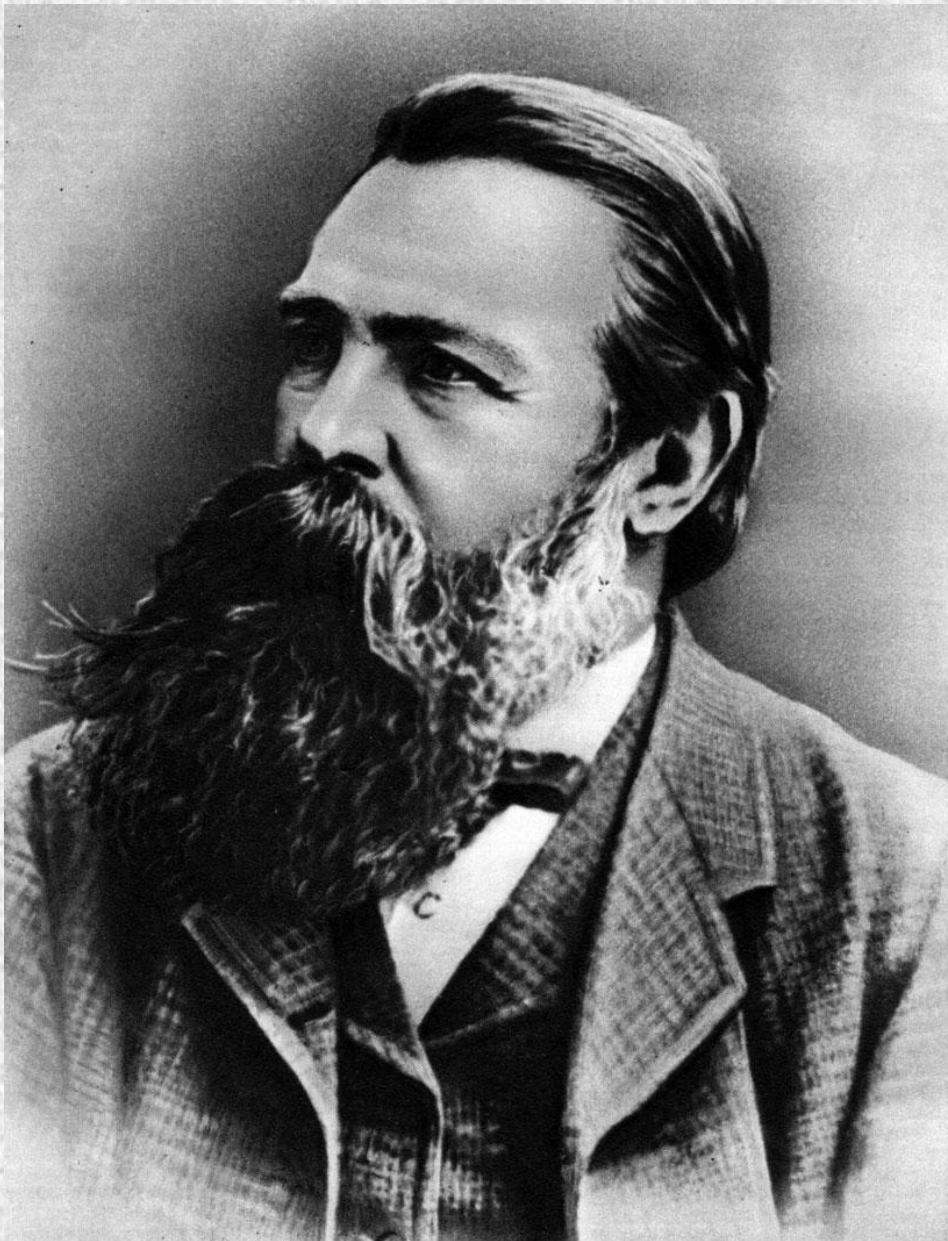
Ф. Энгельс 1820-1895 Немецкий философ