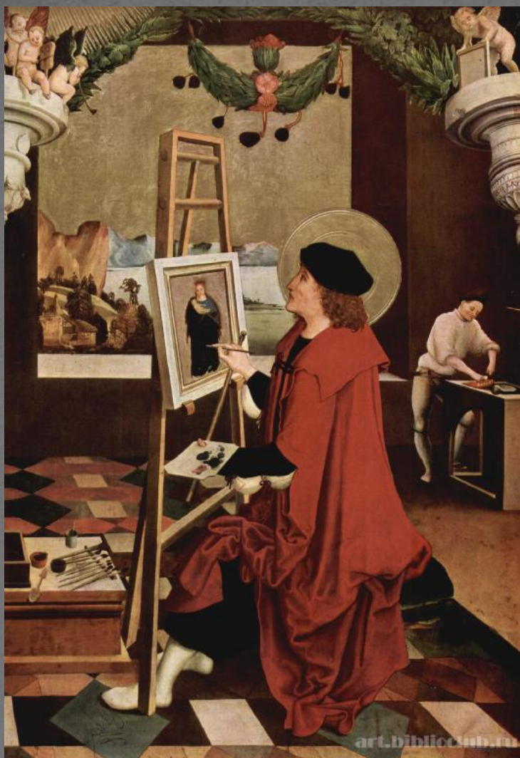
Николаус Мануэль Дойч. Святой Лука, рисующий Мадонну.