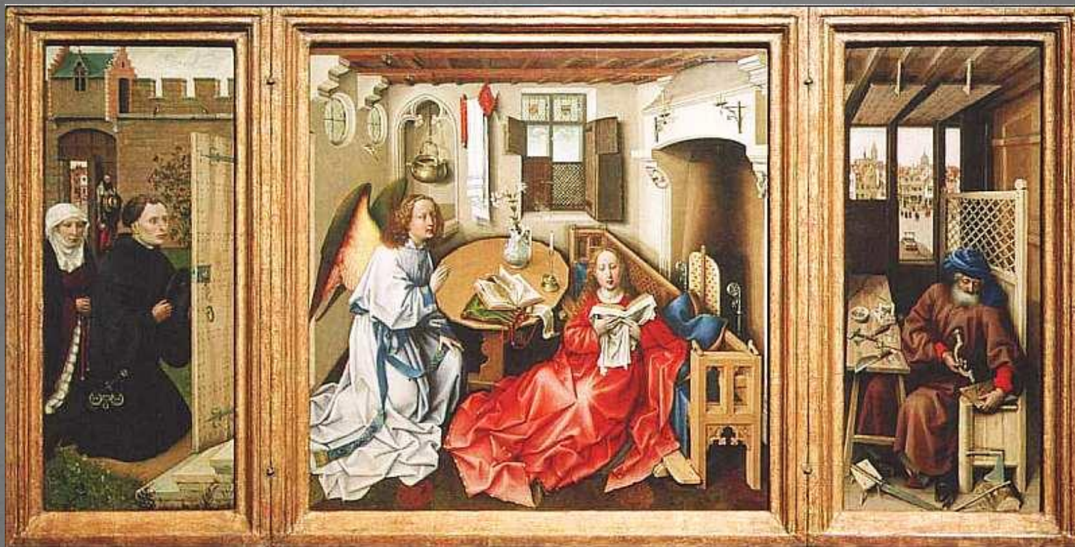
Робер Кампен. Благовещение. Около 1427—1428 гг.