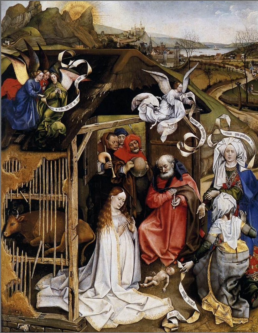
Рождество Христово. Около 1425 г.