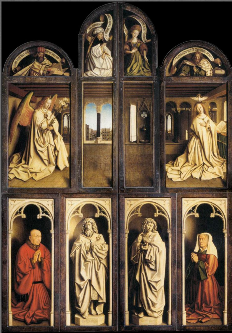
Гентский алтарь , внешняя сторона при закрытых створах.