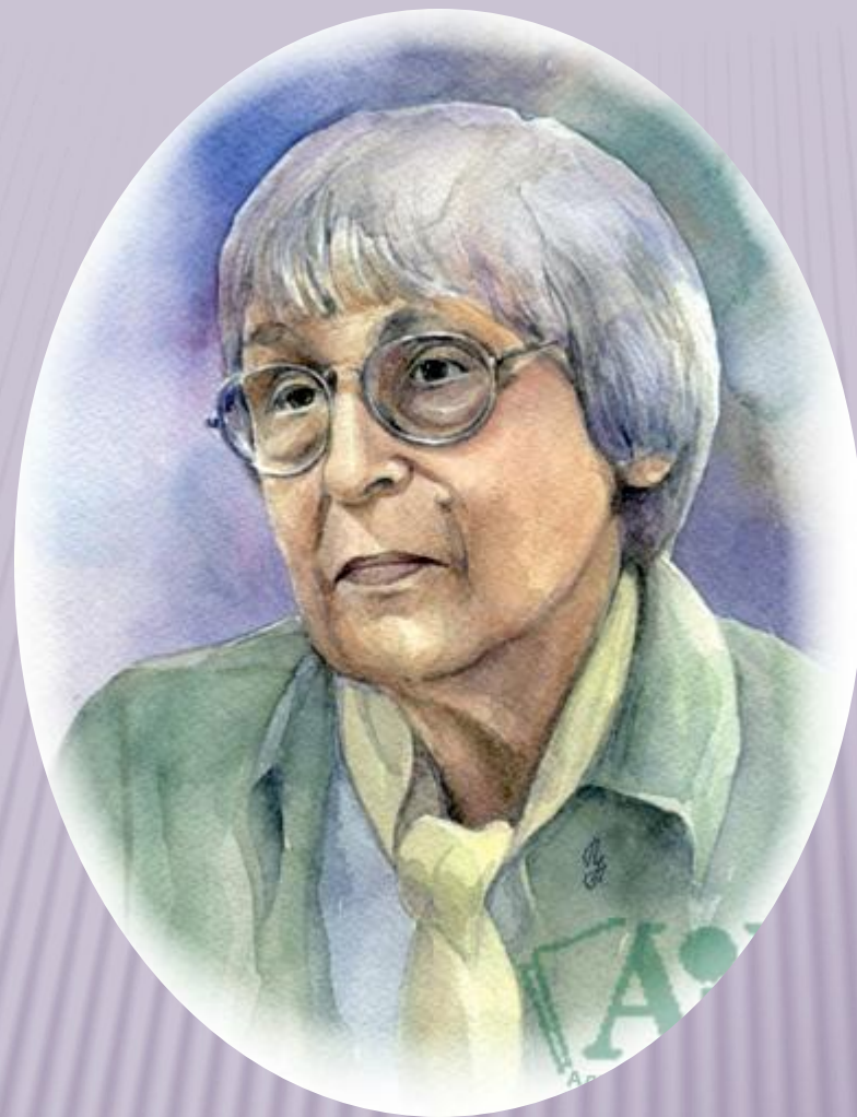
Юнна Петровна Мориц (р. 1937)