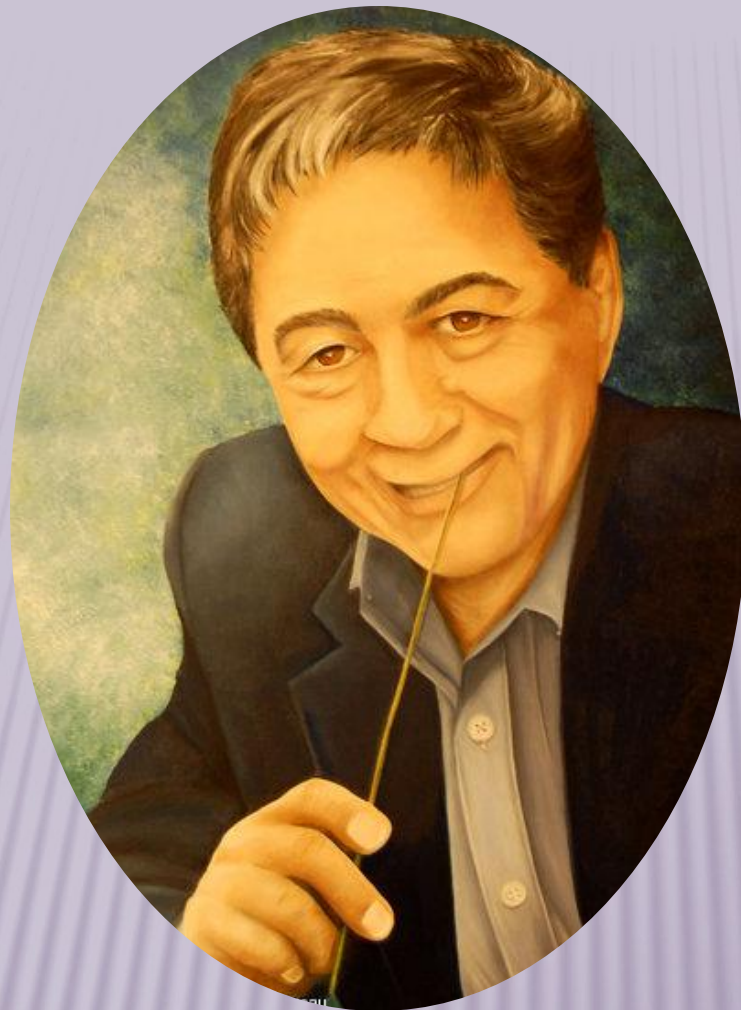
Эдуард Николаевич Успенский (р.1937)