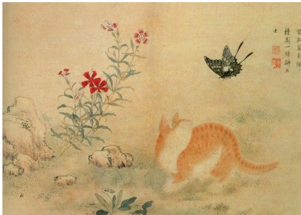
Кот и бабочка. XVIII век. Художник – Ким Дон Хо

Живопись является неотъемлемой частью культуры Кореи. В ней присутствует влияние культуры, но сама по себе она специфична и самобытна. Особый интерес представляет станковая живопись, сформировавшаяся во времена правления династии Чосон. Рисовали на шёлке, бумаге, специальных тканях растительными, минеральными красками или тушью. Если художественная живопись отражала необычное видение мира глазами художника, то народная живопись показывала быт и проблемы повседневной жизни. Можно сказать, что живопись существовала и развивалась в двух направлениях, и оставила за собой бессмертные творения.