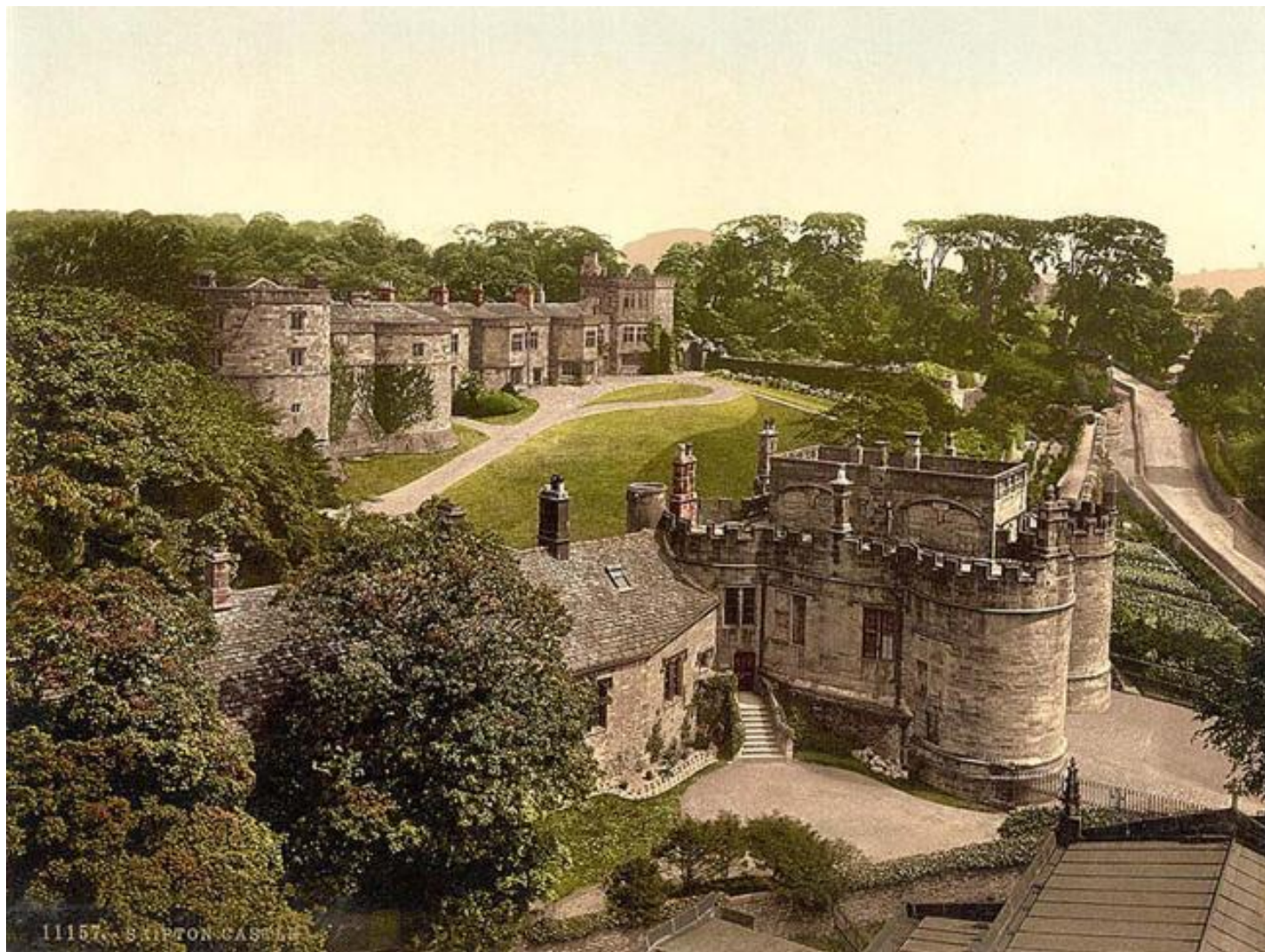
11157. STURTON CASTLE