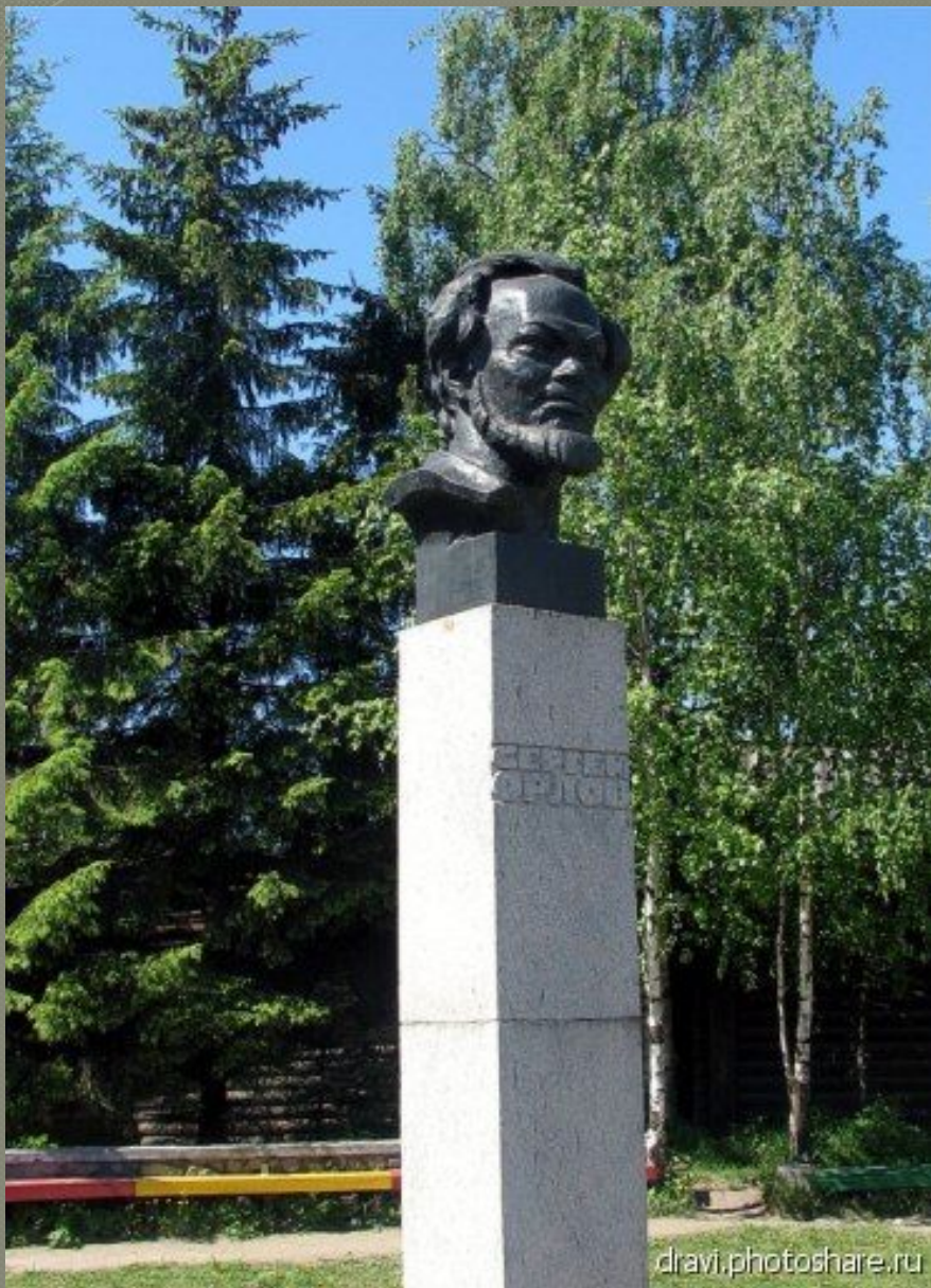
Бюст поэта в Белозерске

На родине Сергея Орлова в городе Белозерске Вологодского края его имя присвоено школе, в которой учился поэт.