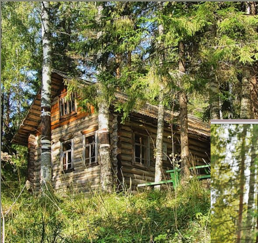
Бобришный угор в Никольском районе. Дом-музей поэта А. Яшина