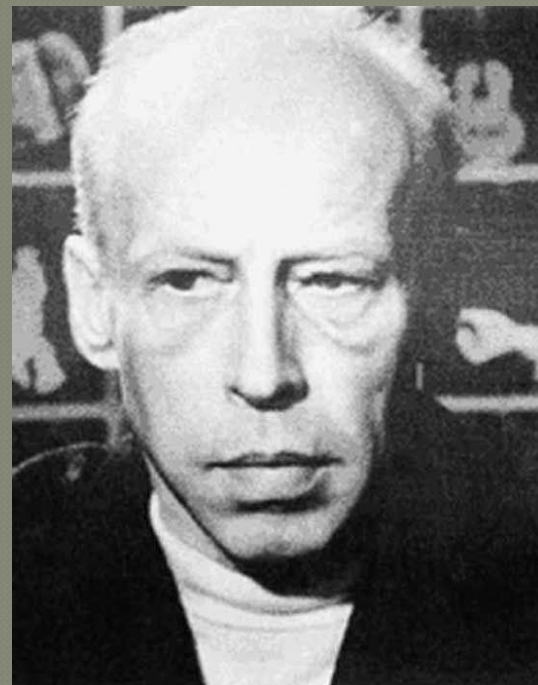
Прозаик Владимир Тендряков