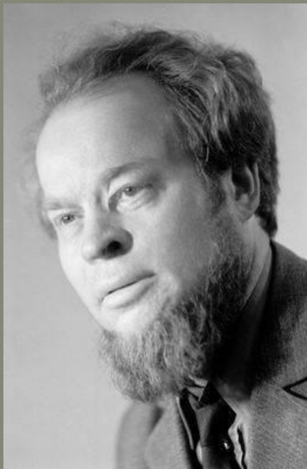
Поэт Сергей Орлов