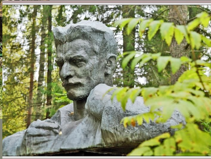
Памятник на могиле А.Я. Яшина