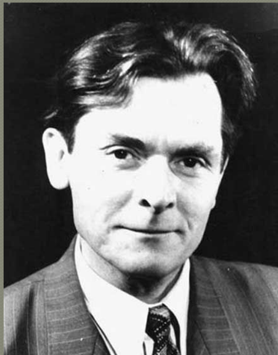
Поэт и писатель Александр Яшин