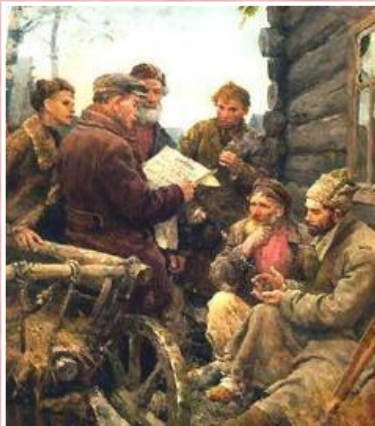
В.Серов. Декрет о земле