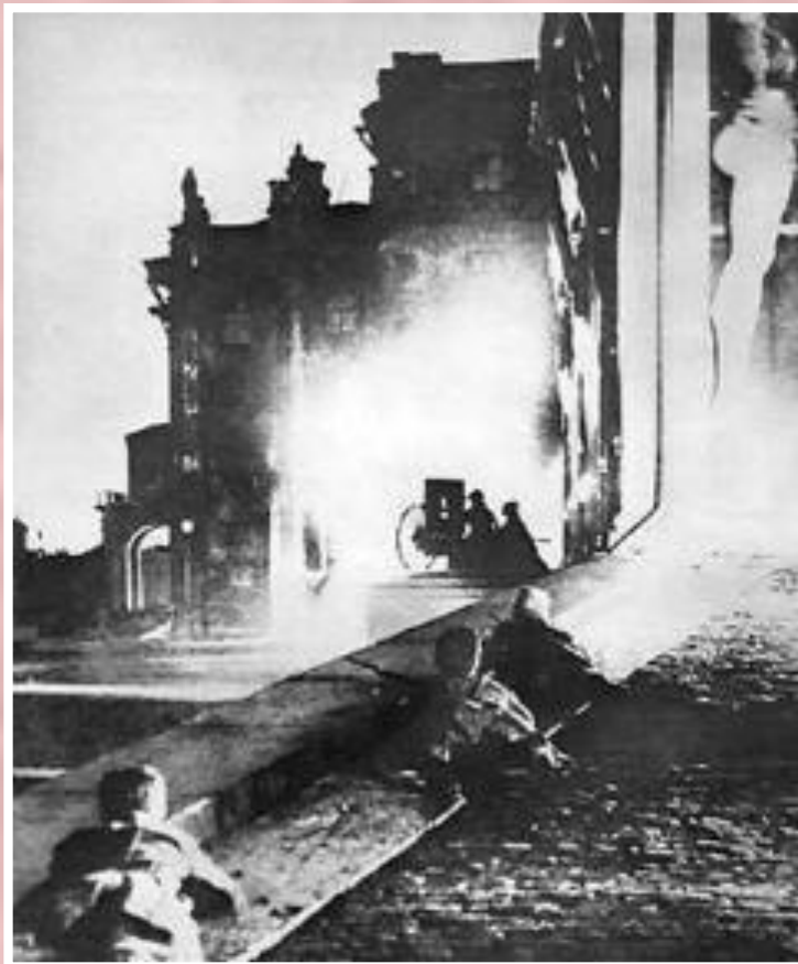
Штурм Зимнего дворца

24 октября правительство закрыло типографию, печатавшую большевистскую газету. В ответ красногвардейцы заняли вокзалы, мосты, почту, телеграф, телефон. 25 октября весь город был в руках восставших. Зимний дворец защищала горстка юнкеров и женский батальон. В ночь на 26 октября Зимний пал. Временное правительство было арестовано. Керенский накануне отправился на фронт за войсками и поэтому избежал ареста.