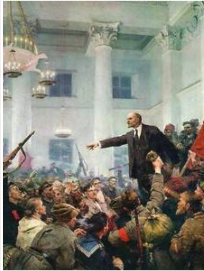
С. Серов Ленин провозглашает Советскую власть

Вечером 25 октября в Смольном открылся II Всероссийский съезд Советов. Большевики и правые эсеры в знак протеста покинули его, лишив себя возможности принять участие в формировании новых органов власти. Однако большевики и левые эсеры имели достаточно голосов, чтобы съезд был правомочен решать судьбу страны. Левые эсеры объявили о создании новой организации – партии левых социалистов-революционеров (ПЛСР).