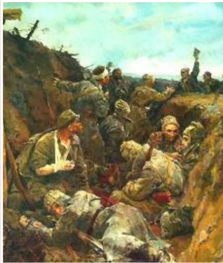
В.Серов. Декрет о мире

В повестку дня были включены «Декрет о мире», «Декрет о земле», «Декрет о власти», принятые 26 октября 1917 г.