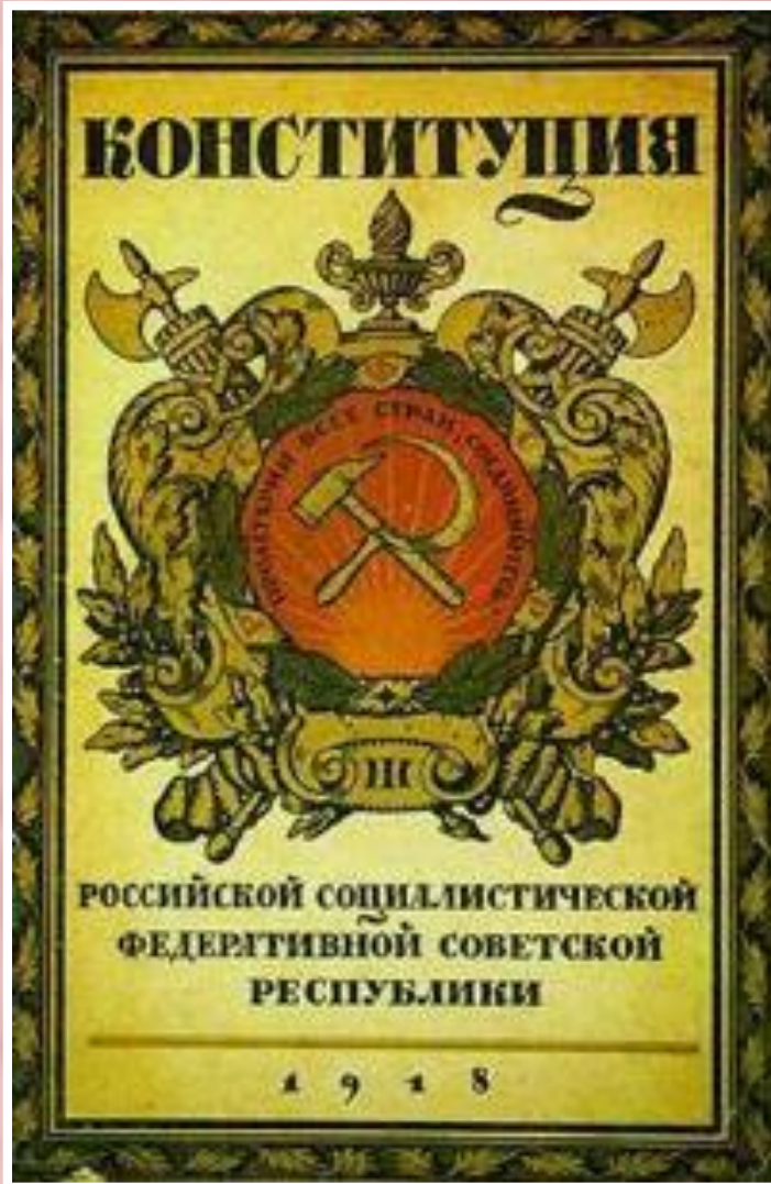
Конституция РСФСР 1918 г.

9 июля 1918 г. V Всероссийский съезд Советов возобновил работу. 10 июля он принял Конституцию РСФСР, которая провозглашала Советскую власть в форме диктатуры пролетариата и беднейшего крестьянства. Высшим органом власти становился Съезд Советов, а в промежутках между Съездами - ВЦИК. Исполнительная власть принадлежала Совнаркому.