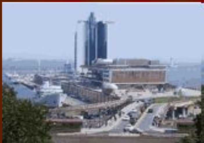
Панорама морского вокзала